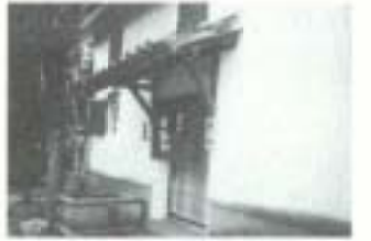
蔵を活用した割烹料理店