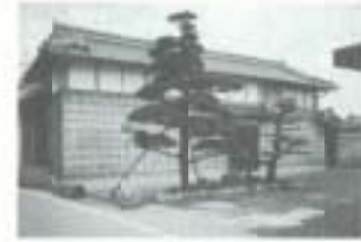
伝統的建築物の修復例