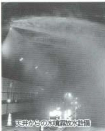
天井からの水噴霧放水設備

トンネル火災で、水噴霧放水設備で火災が消えるのか? 消火というより、火災によるトンネル内の温度上昇を防ぐためのもので、消火栓の放水やポンプ車で、火事は消すとのこと。