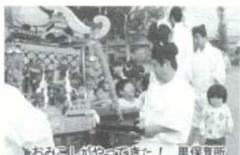
おもしろがってきた! 里保育所