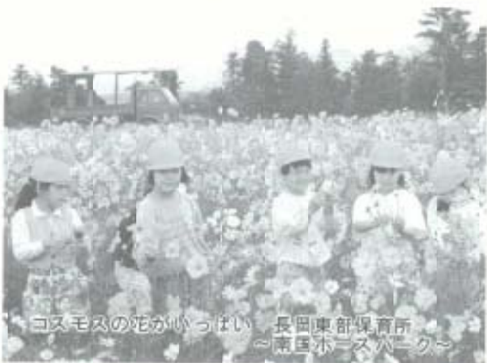
コスモスの花がいっぱい 長岡東部保育所 ～南国木ノスバーク～

子育て支援については、そのコストを削減し効率をよくしたいと考えています。保育行政全般について保育所問題