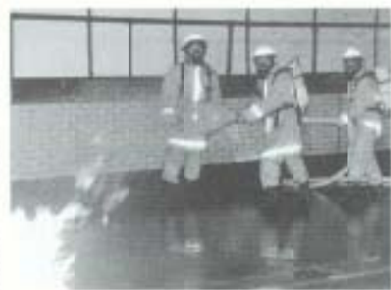
救急活動に続き、火災訓練が行われた。

事故は、明神トンネル内で、普通車と観光バス(県交通・土電・JR参加)が正面衝突して後続の車も追突、重傷者がでたという設定。非常電話から事故発生の通報後、高速隊パトカー(県警)・管理隊パトカー(道路公団)がわずか四分で到着。嶺北・南国・山田各消防署から、救急車が到着するまで六分少々。大破した乗用車をカタ