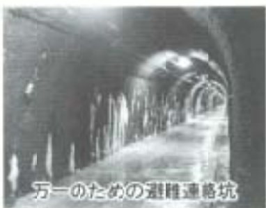
万一のための避難連絡坑

消火訓練に参加して、実際に火を消したバスの運転手さんの感想を聞きもしたが、意外に火は消えにくい。万一事故が発生した場合は、事故と火災が同時に起こる可能性が多いわけで、消火器による初期消火がとても大切だと実感した。また、もし事故発生時に、