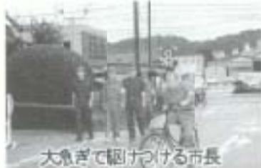
大急ぎで駆けつける市長

当日は午前7時にマグニチュード3クラスの地震が発生し、県内の震度は5~7との想定で実施。原則的に徒歩か二輪の登庁手段で、初動体制が肝心と全員が25分程度で集合。自転車で行った市長からは「いたずらに近道を通ってもよけいに時間がかかる」と報告がありました。この後、災害発生時の対応の再確認や庁舎内の防火設備の点検などを行い、課題や反省点などについての提案の場が設けられました。