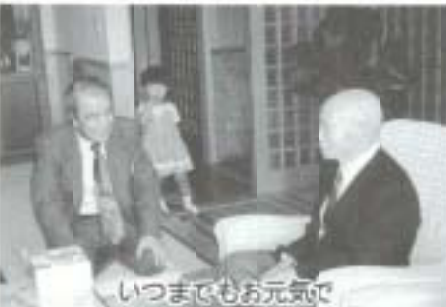
いつまでもお元気で

晩欠かさないといいつわものも、「ひ孫」や「やしやん」に囲まれて楽しく生活しているのを見る、大家族で過ごすことが、長寿の一番の秘訣かも。