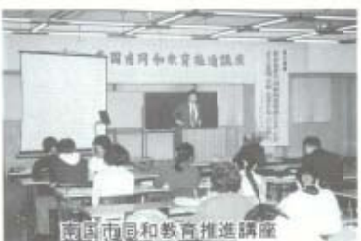
南国市同和教育推進講座

そのようなことはまったくありません。特別措置により当初は利子が多少安く、現在は三・五割ですが、借金は借金ですから、返済が終わるまでは返済が設定され、滞納すれば督促、督促を続けても返さない場合は収用・競売