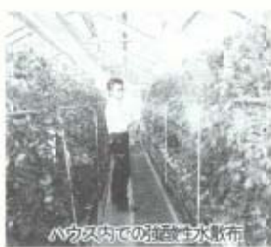
ハウス内の強酸性水散布

き四種の個性をもつ水に変身します。このことから家庭用の浄水器をイメージしましたが、強酸性水や強アルカリ水のように「強」と付くものは、主に農業関係や食品・飲食関係、医療関係で使われているようです。農業面ではハウス園芸や露地野菜、果樹栽培など作物の育成促進、防除に使用されており、市内観光農園のイチゴの水耕栽培をはじめ、県内の農家では低農薬・無農薬で作るメロン栽培などに取り入れられているそうです。