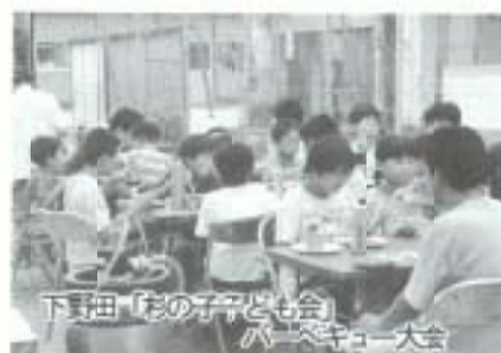
下野田「花の子ども会」バスケ大会

南国市は高齢者対策を今後の市政にとってのキーポイントと位置づけ、元気で生きがいのある市民生活を過ごせるようなまちをつくらせます。 ○ 南国市高齢者保健福祉計画に基づき各種施策の充実を図る ○ 障害者福祉計画の策定を行い、計画性のある施策の実施を図る ○ 障害者や要介護高齢者対策としてのホームヘルプサービス・デイサービス・ショートステイ事業の推進を図る ○ 在宅3次柱の充実 ○ 高齢者や障害者にやさしい道路や公共施設などの整備・改善 ○ 障害者や高齢者の社会参加の場づくりや生涯学習の場などを通して生きがい対策の充実を図る ○ ボランティア活動や、スポーツ活動などへの参加を促進 ○ 定年延長や雇用の場の確保としてシルバード人材センターなどの活用、高齢者の雇用促進と能力開発職場環境づくりを促進 ○ 在宅福祉サービスの充実や在宅介護支援のために社会福祉協議会と連携を