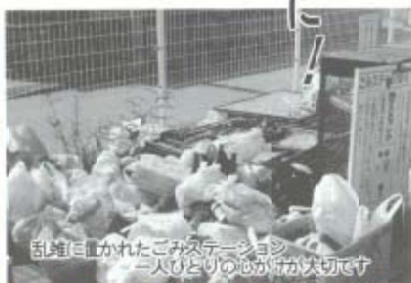
乱雑に置かれたごみステーション。一人ひとりの心がけが大切です。