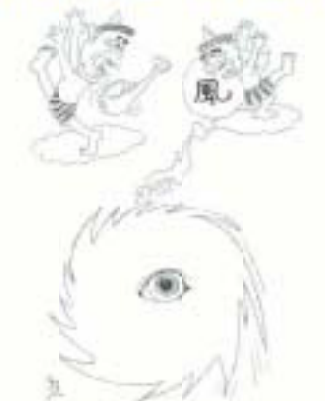
一つ目の大物だ 葛目 義人(岡豊町)