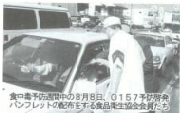
食中毒予防週間中の8月8日、0157予防啓発パンフレットの配布をする食品衛生協会会員たち

健康は全ての行動の源であり、快適な市民生活を営むため市民自らが健康でありたいと思う心を起点とし、乳児から高齢者までのライフステージに応じた南国健康ライフブ