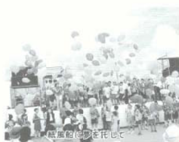
紙風船に夢を託して

南国市の夏の祭典「土佐のまほろば祭り」が八月三日、比江の北部スポーツセンターで開幕した。十の通り市民の祭りとして定着してきたまほろば祭り、走り出そうすべてを未来にと題し、今年も新しい取り組みがいくつもかされた。市職員らによる「まほろば囃子」で幕を開け、ステージではクイズ「勝ち抜きまほろばバトル」や南国踊り、大衆音楽、牛おどりなどを披露。多彩な催しが次々と繰り広げられた。