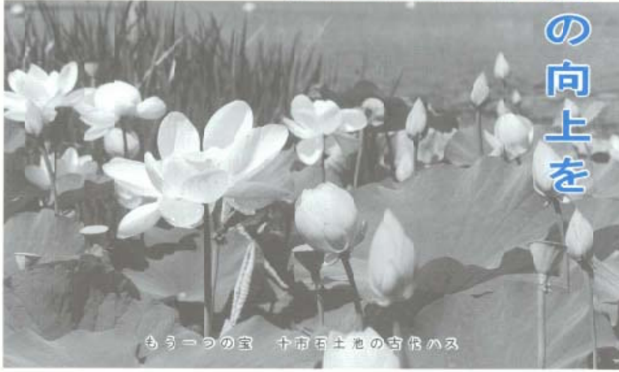
もう一つの宝 十市石土池の古伝の蓮

誘致、反対のそれぞれの市民の運動が進んでいるとの認識をしています。他の市町村でも同様の施設の開設がされるようです。市に対して開設の申し入れがあれば、市長として判断し、議会にも相談します。