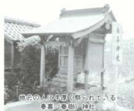
地元の人には手厚く祭られている、春喜(春樹)神社

時代は江戸のころ、藤原村に渋谷権右衛門という郷士の屋敷があり、女中奉公の娘がいた。気だてのやさしい働き者で器量良し。当主の弟、藤四郎は身分をこえて、恋心を打ち明け言いがたが、娘には好き合うた、いいなすけがあった。片想いの怒みから、家宝の皿を一枚隠して、娘にその罪をさせた。当主権右衛門は激怒して、せつかんのあげく娘を殺してしまふ。 それから夜毎、草木も眠る丑満刻になると、「一枚…一枚」と数える悲しそうな声、「九枚…ああ一枚足りない」うらめしうに泣く声に、藤四郎は高熱を出し、ついには苦しみもたえ死ぬ。板縁には、毎朝娘の血ぞめの足型がいくら式いても消えない。当主も恐怖におののき、屋敷の西方に、九尺四方の社殿を建てて堂をなぐさめた。一尊喜神社の由来、娘の後を追った婚約者は、別の