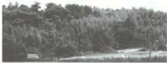
悲しい言い伝えの残る比江山

徳のお墓であると言われている。昔は、郷士を恨んだ徳の魂が火玉となつて、毎晩後免の郷士の家の大杉まで飛んでいた。郷士は、気味悪がって、止田に転居したが、火玉は、どこまでも追っかけていったということだ。 封建時代の悲恋を秘めた、ほこらの一角は、現在、地元民の手で、美しい花壇が造られており、地藏尊には、可憐な草花と線香が供えられ、知恵を授け、子供の守り地藏として信仰されている。また、毎年八月末の日曜日には、盛大な地藏祭りも行われている。 (参考文献、南国市史・大障村史)