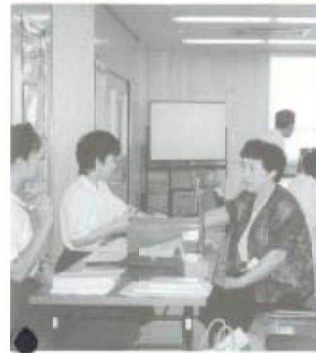
高血圧予防教室の様子

今まで血圧やコレステロールが高いと言われて、そのままになっていませんか。病気について知りたい人、体にいいことを始めたい人、お気軽に健康づくりの講座に参加してみませんか。 【参加料】 無料 【定員】 20人 【申し込み】 8月20日(火)までに 保健福祉センター ☎7373