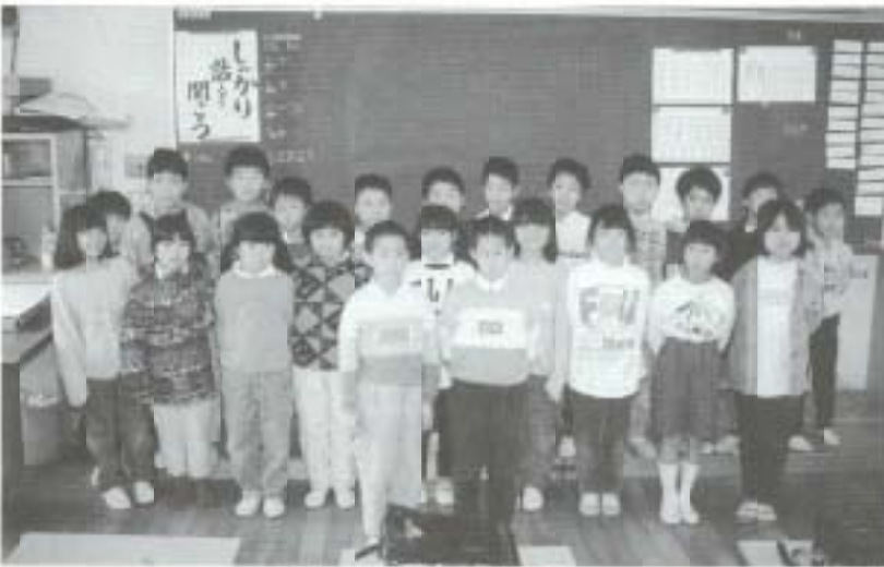
クラスみんなと教室で

トによると「普段はニコニコしているけど言ひ出したときかない頑固なところがある」そうで、怒ると結構こわいそうです。ボールのぶつけあい