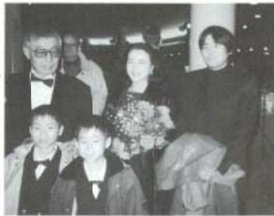
監督、共演者らとドイツのホテルで

さて、主役の二人はというと、いたってマイペースで、心配されたセリフ覚えも難無くこなし(人のセリフまで覚えてしまい、自分のセリフと区別するのに苦労したとか)、撮影も順調に進