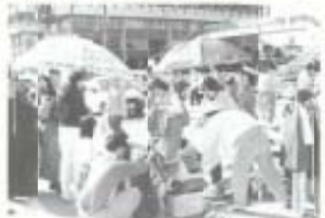
前回のフリーマーケットの様子

参加費は500円です。 ※申し込みはハガキに氏名・住所・電話番号を記入し5月15日までに社会教育課(市役所内線321)へ