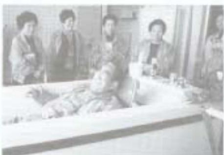
施設などを視察するプランナーの皆さん

歩けるような 環境作りをす る▼各地区で 行われている 運動教室など を広く知らせ る▼小さなボ ランティアの ネットワーク を作り、支え 合う活動を広 げる▼不法投棄をしないとい うモラルの確立、ごみ減量の ために努力する▼地域を知っ てもらうために文化財の説明 をするボランティアを養成す るなど、点として存在する文 化財を線につなげ、面に広げ て活用する