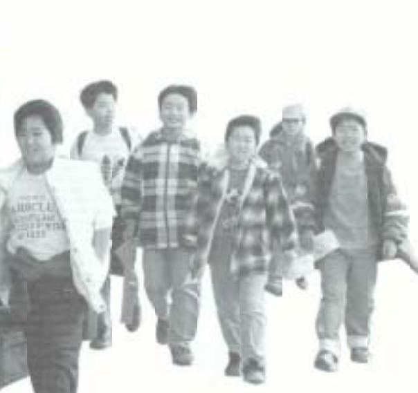
子供たちには健やかに育ってほしいものです。

「保育所問題検討委員会」で、本市の保育の実態を踏まえた将来の保育行政のあり方についての提言を受け、保育制度の充実に向け積極的に取り組まします。