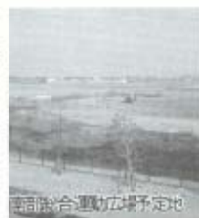
総合運動広場予定地

「保育所問題検討委員会」で、本市の保育の実態を踏まえた将来の保育行政のあり方についての提言を受け、保育制度の充実に向け積極的に取り組まします。