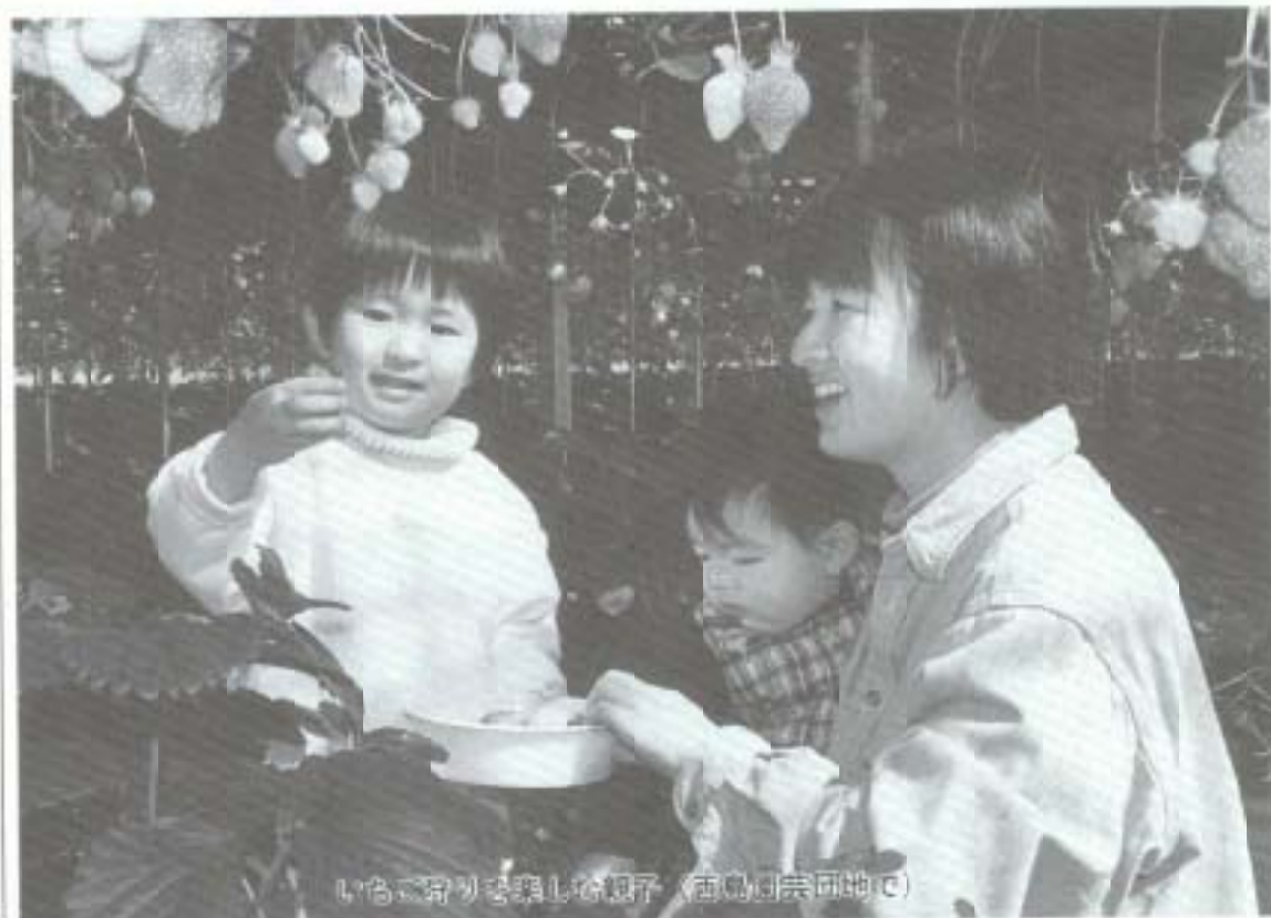
いちご狩りを楽しむ親子（西島園芸団地で）

皆さんは土を使わず、十ばらしいバラの花がつけれると思いませんか。南国市にマッシュルームを栽培している会社があることを知っていますか。西島園芸団地のいちご狩りは