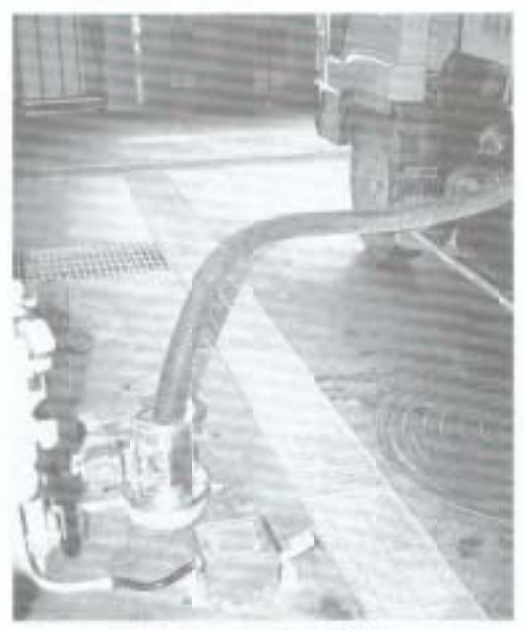
バキュームカーから処理ラインへ投入

処理施設は完全密閉式で、予想した悪臭は皆無である。処理済みの透明で、無臭、無菌の水は、パイプ（全長一・五キロ）で土佐湾に放流され、固形物は分解、焼却されて灰になると担当職員から説明があったが、機械や化学に弱い私には、理解できない事が多