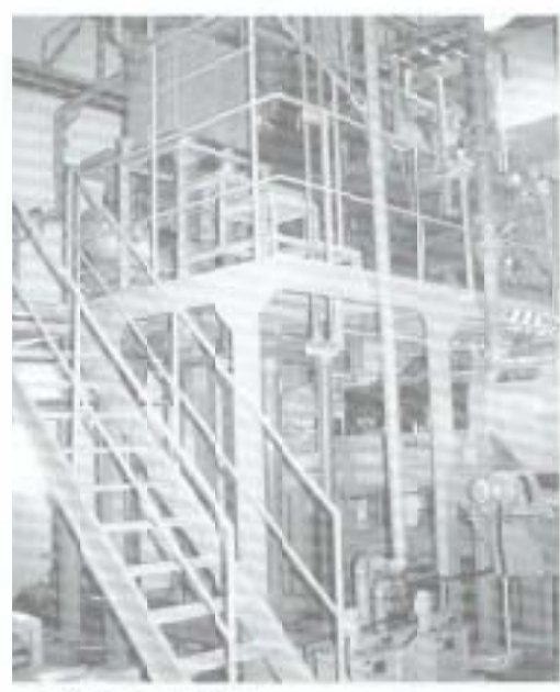
プラント内部 まるで薬品工場のような内部施設

かった。要は、バクテリアにの尿本となって、大気中に放出されているとのことで、その完全な処理に、ただ驚くばかりである。 処理棟の内部は明るく、清潔な感じの色彩が施されてい