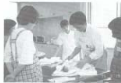
〈これからママの集い(母親教室)〉 友達づくりに発展しています。

に、乳幼児健診のほかにもいろいろな事業を行っています。出産を控えた両親を対象にした「これからママの集い」