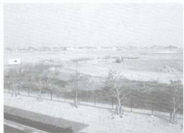
隣地はグラウンドになる予定