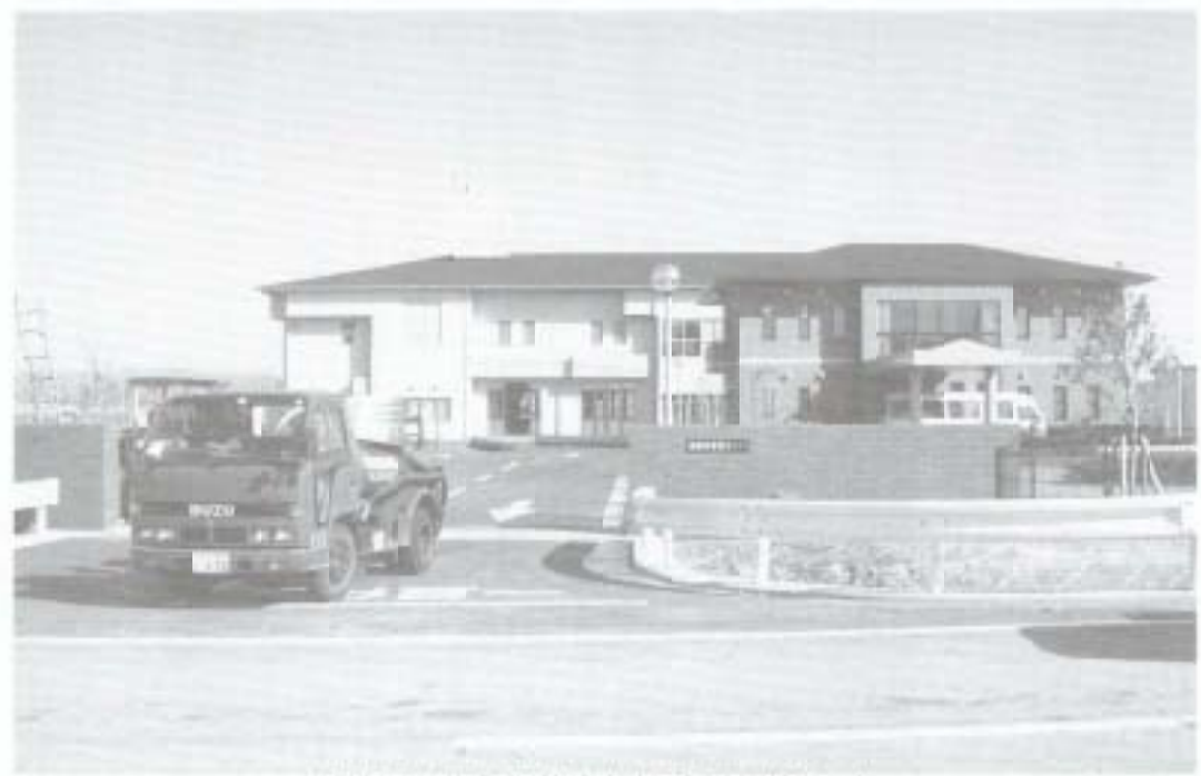
2月23日に落成式が行われた南国市環境センター

市民生活に絶対不可欠である新しい、し尿処理施設が完成し、稼働していると聞いて、早速、見学させていただいた。田園地帯、広域農道に沿った前浜地区に、三年の工期と三十二億円をかけた施設は、オフィスビルを思わせる近代的な明るい建物で、美しい庭園も備えていて、清潔で広々としていた。正門には、「南国市環境センター」との表示があるが、バキュームカーの出入りがなければ、到底、し尿処理施設とは思えない建物である。