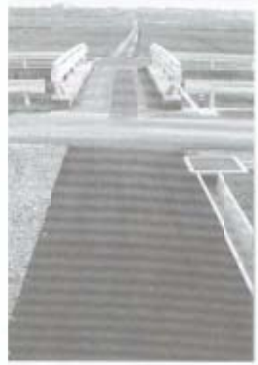
排水路 この道路敷に排水パイプはるか太平洋へ