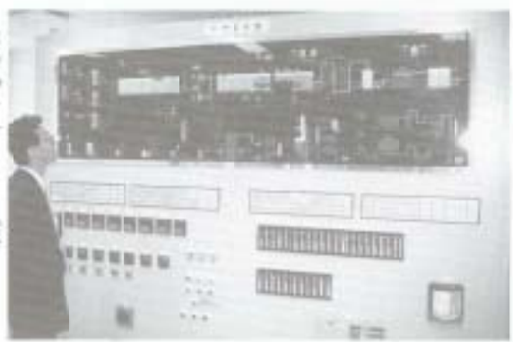
コンピュータ室 管理はすべてコンピュータ

かった。要は、バクテリアにの尿本となって、大気中に放出されているとのことで、その完全な処理に、ただ驚くばかりである。 処理棟の内部は明るく、清潔な感じの色彩が施されてい