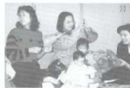
〈びよびよルーム〉 お母さん〇Bの応援もあります。

よルーム」などです。参加者からは「出産後にまた合おうね」「少し父親になるという実感が持てた」「重心に返つて楽しい」など、これからの事業を通して仲間づくりに進んでいきます。 今日参加されているお母さんの中でお二人は「びよびよルーム」を通じてできたサークル「わいわいキッズ」に参加されていますが、参加していかがでしたか。