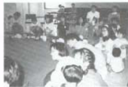
〈子育て教室〉 人工呼吸。みんな真剣です。

も自分たちだけでももう少し集まりたいと思つて声を掛け合ひ、わいわいキッズが始まりました。 岡山 県外から嫁いできて同世代の友達がいなかったのので、びよびよルームには早くから参加してました。夜泣きがつかつたのですが、話し合うことで解消しました。月一回だと病気や用事で来れないことがあるので、週一回保健福祉センターを開放していただければと思ひます。