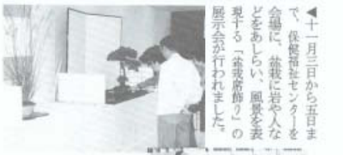
▶十一月三日から五日まで、保健福祉センターを会場に、益我に若や人などをあしらひ、風景を表現する「益我府」の展示会が行われました。