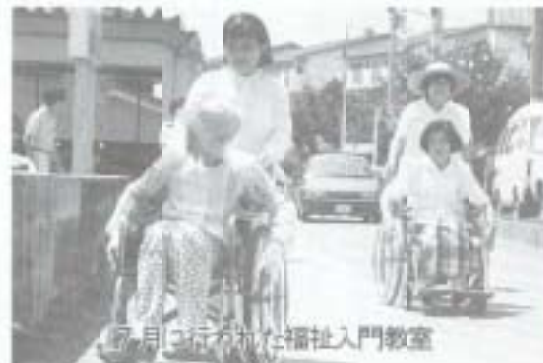
7月に行われた福祉入門教室

南国市社会福祉協議会は、 地域に即した福祉サービスの 提供とそのシステム化を目指 して、平成5年度からふれあ いのまちづくり事業に取り組 んでいます。主な事業は、ふ れあい相談所の設置、給食サ ービス、花いっぱい事業の推 進、福祉機器の貸与延長とリ サイクル推進、小地域福祉ネ ットワークづくり、入浴施設 の開放などです。