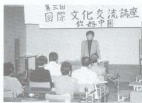
▲11月12日、市役所大会議室を会場に第3回国際文化交流講座が行われました。今回は高知大学農学部留学生を招き「ニーハオ中国」と題して、中国の文化や中国語の講座が行われました。