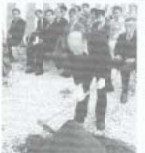
▶十一月八日、久礼田地区集会所ほ場整備事業の起工式が行われました。同事業は市内では岩村地区について二番目の着手となり、五か年計画で約四十四haを整備する計画です。