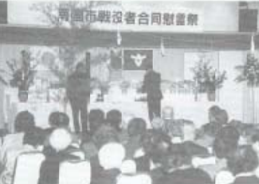
▶十一月十日、戦後五十年目の市戦没者合同慰霊祭。