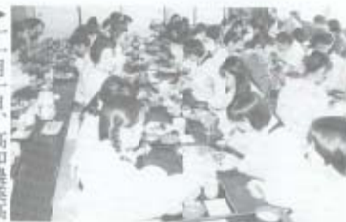
▶十一月十日、高知農業高校で、同校生活科の生徒や生活改善グループのメンバーらに参加し、おいしくお米を食べる交流会が開催されました。