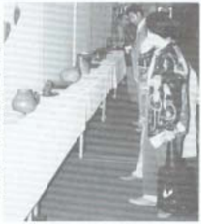
▶南田市文化祭が十月二十二日から二十九日まで開催され、市内の文化サークルなどによる展示、舞台発表などがありました。