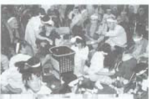
▶スポーツの秋、文化の秋。「夢の里」では十月二十五日に秋の運動会(上)、十一月十二日にグループ「ハーモニド」によるハーモニカの演奏、ハミングバードグループによる合唱がありました。