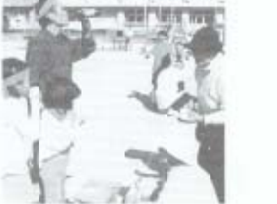
▶十一月五日、大塚小学校グラウンドで母子・父子・専業主婦運動会が開催され、参加した五十人ほどは趣向を凝らした十競技に、心地よい汗を流しました。