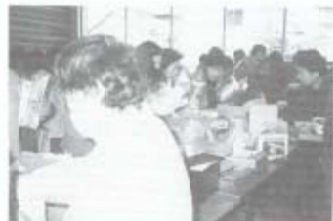
▶十一月十日、社会福祉センターでの福祉バザー。