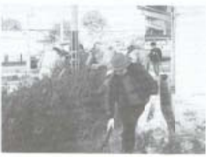
▶十一月十九日、四国電気保安協会創立三十周年を記念し、同協会土佐山田支所の従業員とその家族の人たちが、社会に貢献する活動として、西山の広域農道付近を清掃しました。