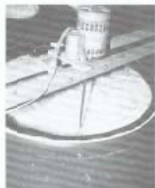
麹菌を入れた米、酵母、中ノ川の水をタンクに入れ醗酵させます。麹、酵母の具合、醗酵のさせ方が酒の味を左右します。杜氏（とうじ）の腕の見せどころ。