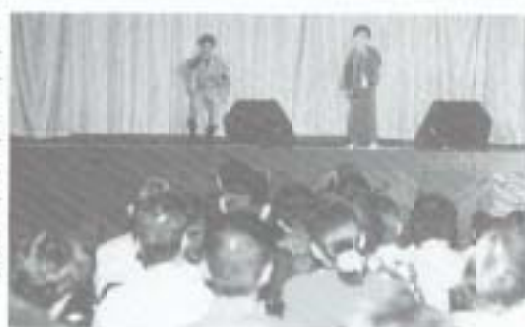
▶十一月五日、市民体育館を会場に南田ボランティア歌謡紅白歌合戦が行われました。出場した約百二十組の熱唱に、訪れたお客さんは聞き入っていました。