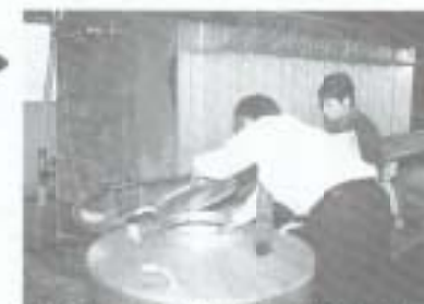
醗酵したものをろ過し酒粕と酒にわけ。タンクごとに微妙に味が違う酒を調合し、味を整えていく。