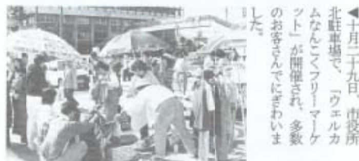
▶十月二十九日、市役所北駐車場で、「ウエルカムなんこくフリーマーケット」が開催され、多数のお客さんにぎわいました。