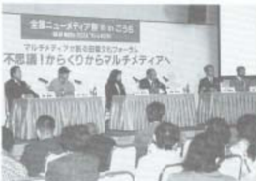
▶十月二十七日、ニューメディア祭南国会場で、「マルチメディアが創る田園文化」と題したフォーラムが行われました。