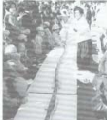
▶十一月十一日、吾国保育園二十周年を記念し、「吾国市」が開催されました。園児や家族の人たちは、三十日もある巻寿司づくりや、バザーなどで楽しみました。