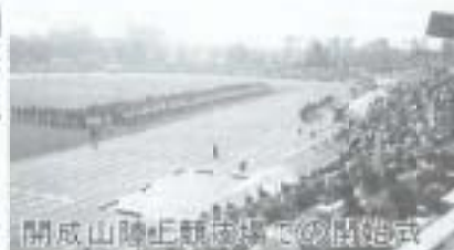
開成山陸上競技場での開成式

七年後に迫ってきた高知国体。南国市では四つの競技(サッカー、バドミントン、バスケットボール、ピストル射撃)が行われる予定ですが、今月号から随時、国体について紹介していきます。