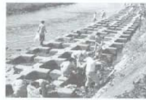
▶十月二十五日、四国電力が地域の人たちとのふれあいを大切にする「よんどんルネサンスふれあい旬間」の一環として、国分川の清掃を行いました。