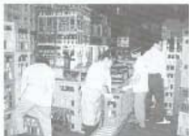
できあがった「貫之」はピンに詰められ出荷されます。