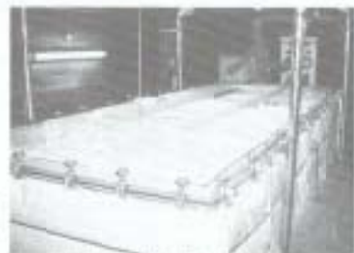
蒸した米を糖化させるため麹菌を入れます