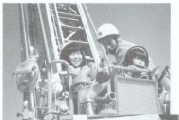
▶十一月三日から五日まで、防災意識を高めることを目的に、日本損害保険協会の主催で「防災プラザ高知」が市内の量販店で開催され、地震体験機、強風体験機などのコーナーに多数のお客さんが訪れました。