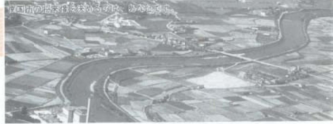
南国市の将来像は決まらず、あやふやです。