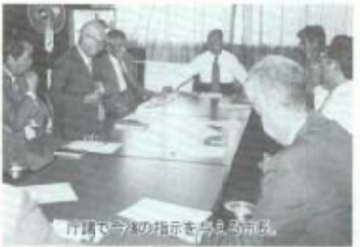
庁議で今後の指示を受ける市長。

たものと深く受け止めている。懸案事項が山積みしており、これからの正念場だ。南国オフィスパーク、し尿処理施設などは手がけてきたが、後免町再開発、吾国山文化の森公園、高知空港再拡張や立成一四年の高知国体、高齢者福祉など、莫大な経費を要する事業が残されている。向こう四年間は厳しい経済状況の中でいかに財源を確保していくかが課題だ。山積みの課題をどのように選択して、市民の理解を得ながら進めていくかが勝負どころであり、真剣に取り組んで市民の期待に応えたい」と抱負を語りました。