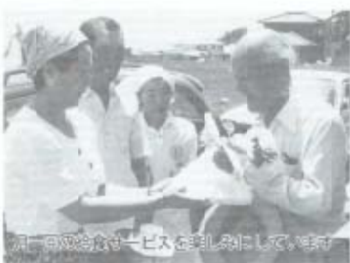
児童会館でサービスを実施している様子

参加が不可欠です。現在ボランティアによる居老人を対象にした給食サービスが、月一回から年数回の頻度で市内各地で行われていますが、毎回大変楽しみにしている方が多くいます。地域に呼びかけて、ボランティアとして参加する人たちにも負担にならずに活動できるように進めていく必要はありますが、平成十一年には市内全域に広げる計画になっています。