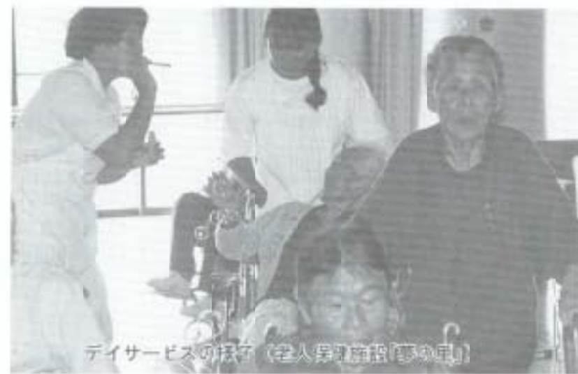
デイサービスの様子（老人昇降施設（車いす））