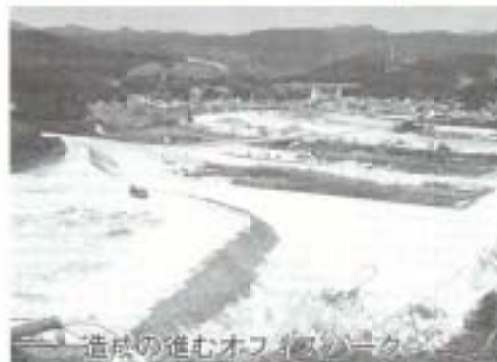
造成の進むオフィスビル

この議会は、市長、議員にとって任期最終の定例議会であり、市長は四年間の総括、現状と課題、今後の方針について所信を表明しました。