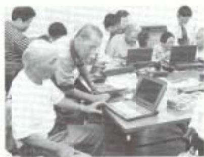
保健福祉センターでのリハビリ教室

保健福祉センターの完成で、乳幼児健診、総合健診(成人病検診、胃がん検診、子宮がん検診など)、機能回復訓練、健康づくり講演会、各種運動教室などの事業を拡大充実。保健福祉の拠点として充実、強化しています。