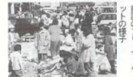
前回のフリーマーケットの様子

南国市フリーマーケット実行委員会が10月29日(日)、午前10時から午後2時まで、南国市役所北側駐車場(旧図書館前)で開催します。売って楽しい買ってうれしいフリーマーケット。参加費は500円です。 ※申し込みは10月20日までに社会教育課(☎市役所内線321)橋田まで