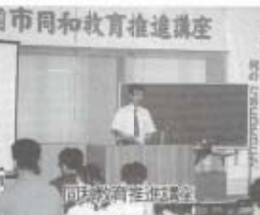
同和教育推進講座