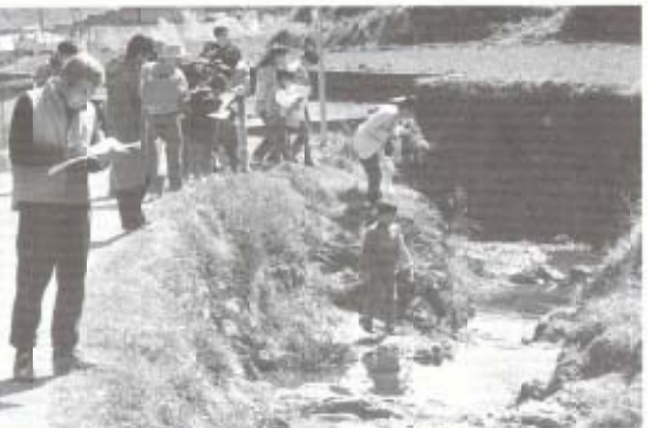
AS奈路倶楽部の行っているあぜ道探検隊は大人と子供が一緒になって地域を探検します

こちらでは、高齢者が福祉施設や病院に多くいて、若い人と離れているような気がしますが、家で面倒を見る人がいないのかもしれませんが、よく理解できないことのひとつです。