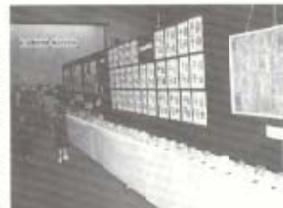
部落解放をめぐって、取り組んできた成果や課題を持ち寄り、発表提起することにより、部落解放への意欲を高めると共に、地域の文化、教養の向上を図ることを目的とし、六十二年度より実施、今年度は、十一月十一日〜十二日、西部体育館で開催予定