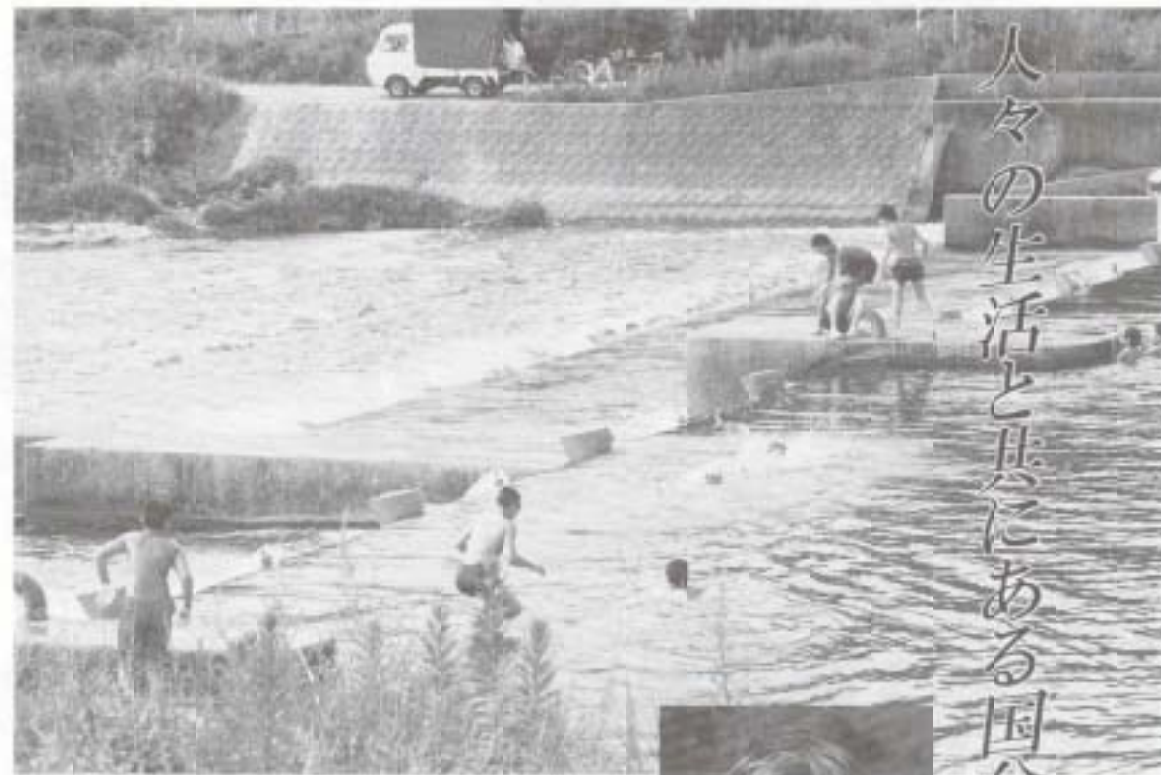
国分川で泳ぐ子供たち このような光景も最近少なくなってきました(高豊町沈下橋付近)