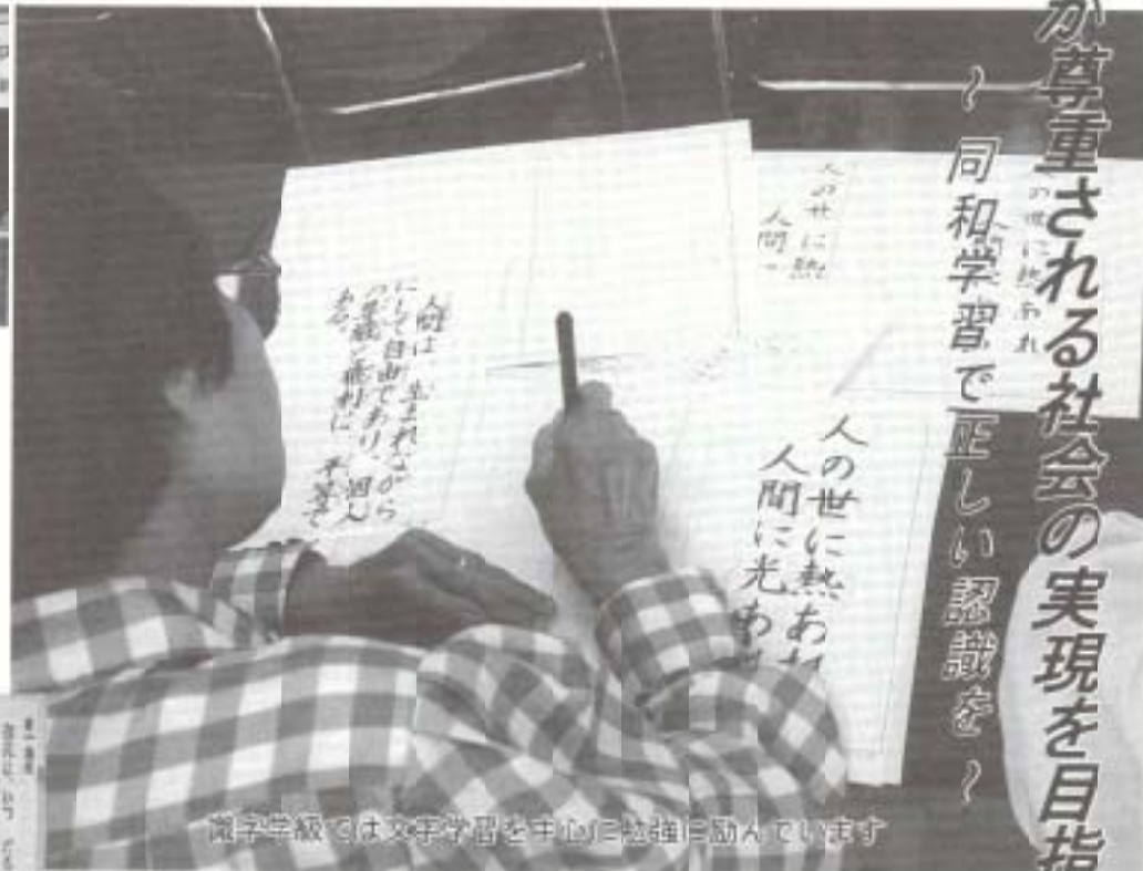
識字学級では文字学習を中心に勉強に励んでいます