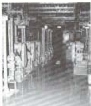
新し尿処理場の内部

浦戸湾東部流域関連公共下水道事業は認可区域を六十一ha追加して二百九haで整備。大橋、後免町、長岡地区の一部七十七haで供用開始し、接続可能件数約千四百七十件。このうち三百六十九件が大注化されました。今年度は野中、藤原、西窪で実施します。農業集排水事業は、浜改田地区で約十四億円の事業費(平成十年度完成予定)で実施する計画。今年度は処理場設計、汚水管布設工事を実施しています。合併浄化槽の普及と共に、水洗トイレ化、河川浄化を促進します。