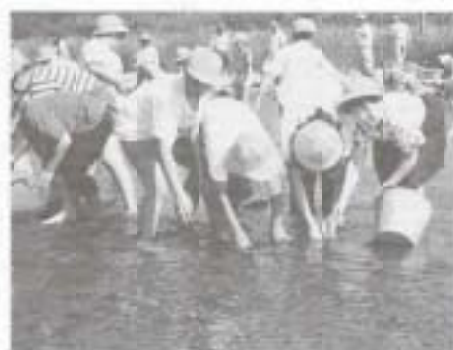
コイを放流する子供たち

小学生と一緒にいる鯉の稚魚の飼育放流や、早春の土手の芝焼き、七草がゆは、南国市の風物詩として定着しつつあると思います。