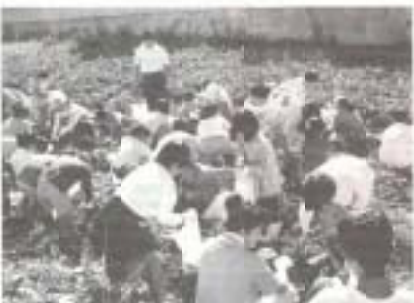
識字学級生との交流