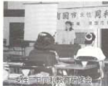
女性一日同和教育研修会