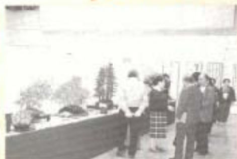
あなたの文化心、 発表しませんか

市民の日ごろの創作活動を自らの手で発表する「岩沼市民文化振興祭」が、今年も10月18日から11月5日まで、市民会館を開場し開催されます。