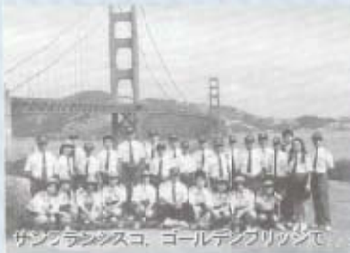
サンフランシスコ、ゴールデンブリッジで