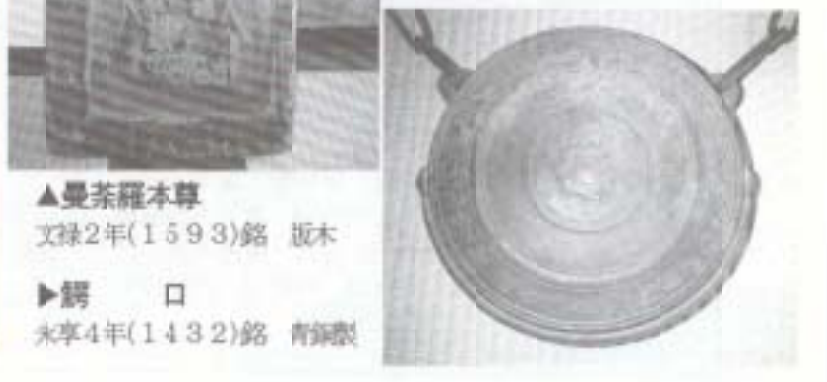
▲曼荼羅本尊 文禄2年(1593)銘 板木 ▶鑄 口 永享4年(1432)銘 青銅製

南国市保護有形文化財に指定 南国市教育委員会は、今年四月に細勝寺(田村)所蔵の次の二点を、市文化財保護条例により、南国市保護有形文化財に指定しました。