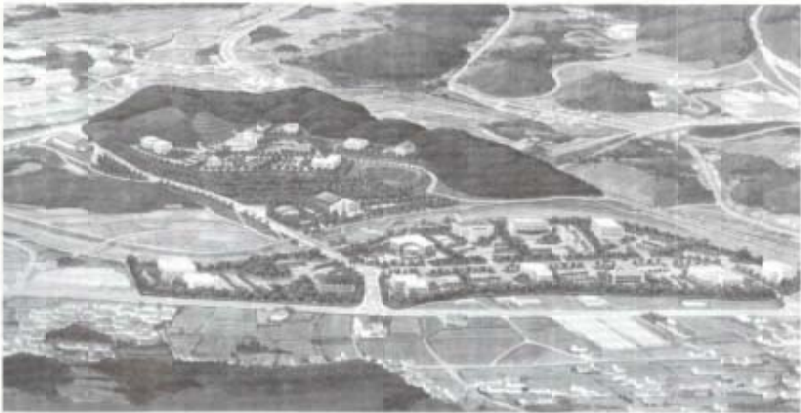
▲ 南国オフィスパークの完成予想図 ▶ 領石川の親水公園予想図