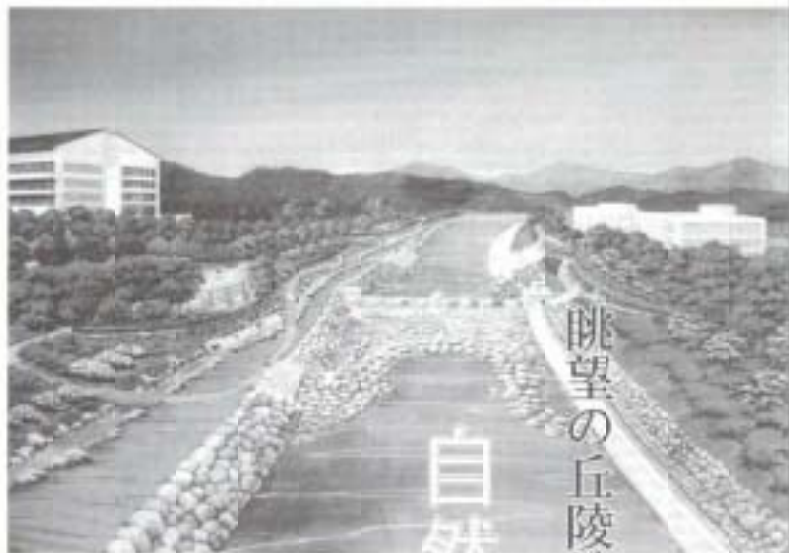
眺望の丘陵地・領石川の親水公園