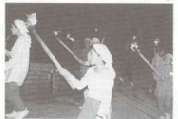
研修会で キャンプの夜はやっぱりキャンプファイヤーで盛り上がります

で活動を続けています。活動としては南園市内の各地区の子ども会(単位子ども会)の行事「キャンプ、野外炊飯、クリスマスマス会」や南園市連行事に参加し、子どもたちの指導にあたります。また、廣知県のJ・L講習会・中国、四国大会・全国大会などの研修会に参加しJ・Lとしての指導力を高める努力を重ねています。そして、これらの行事に参加するための計画・準備などを行う青少年教室を自分たちで開催するなど、情力的に活動を続けています。