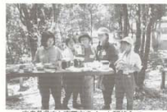
広島県呉市と南園市のJ・L研修会で野外炊飯の様子

ジュニア・リーダー(以下J・L)とは、子ども会の育成者と子どもたちの架け橋となり、お兄さんお姉さん役として、実際に子どもたちの活動を指導していく役割です。南園市J・L組織は、歴代のリーダーの努力で飛躍的な発展を遂げ、県下にも名を馳せてきた伝統があり、南園市のボランティア精神あふれる中、高校生