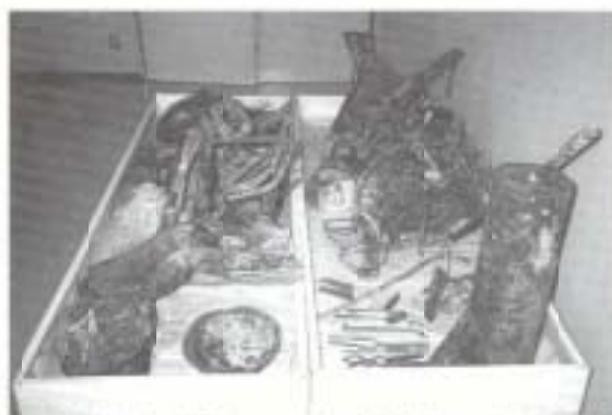
▲焼却場河川に混入していた多種多様な不燃ゴミ

南国市では、早くから「生ゴミの減量化」や「金属のリサイクル」を推進してきましたが、焼却場に入入されている可燃ゴミには、まだまだたくさん、ビン・カンなど多種多様な不燃ゴミがまじっています。このため、施設の稼働を一部停止し、不燃ゴミを取り除く作業をこれまで何回も行っています。