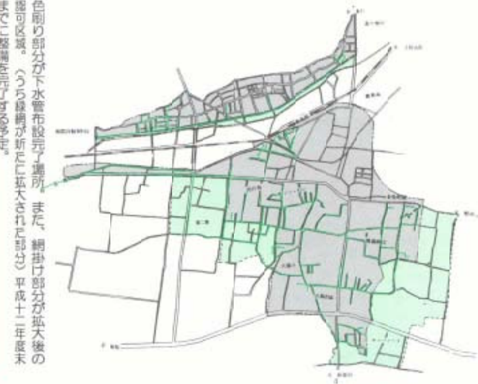
色刷り部分が下水管布設完了場所。また、網掛け部分が拡大後の認可区域。(うち緑網が新たに拡大された部分)平成十二年度末までに整備を完了する予定。

負担金対象区域などの感覺今年度新たに受託者負担金の対象区域となる土地の所有者の方に、その旨を通知いたします。また、下水道課関係書類などを縦覧することができ、四月一日・十四日の間におこなわれます。 浦戸湾東部流域関連公共下水道の認可区域も同じ縦覧場所、期間です。【下水道課】