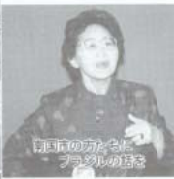
南国市の方をブラジルの話を