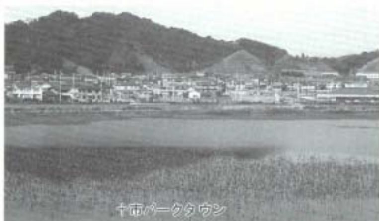
十市バイオタウン

「住んでみたい、住み続けたい」という、魅力と愛着のもてる南国市にしてはきたハですね。（次回は、このシリーズの最後の「総集編」として、全体の進捗状況をご紹介します）