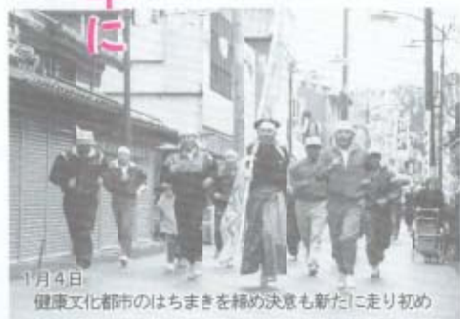
1月4日 健康文化都市のはちまきを締め決意も新たに走り初め