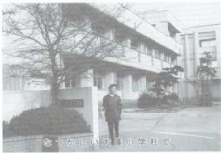
なつかしい大塚小学校で

はずだと私たちは懸命です。 ここ南国市は私たちの町から見れば本当にうらやましいくらい行きどどいた整った思いやりのある町なのです。その南国市が二十一世紀を先取りする新たなビジョンかつの町づくりに励んでいられるその熱気がひしひしと感ぜられます。 南国市のますますの発展をお祈り致します。