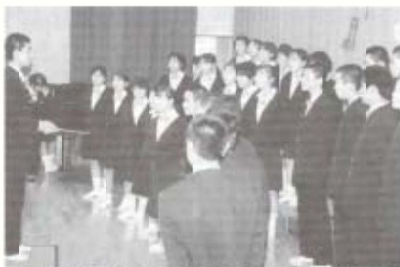
▲1年から3年まで、すべてのクラスが参加して行われた合唱コンクール。休み時間や放課後のわずかな練習時間にもかかわらず、各クラスみごとな団結力ですばらしい歌声を披露してくれました。

香南中学校では十三日に「温故知新」をテーマにして、恐竜の世界、古代エジプト、また、阿蘇山についてなどの研究発表をこころ文化部の発表や、全クラスが参加しての合唱コンクールがあったり、秋の一日、みんなが団結してすばらしい文化祭となりました。