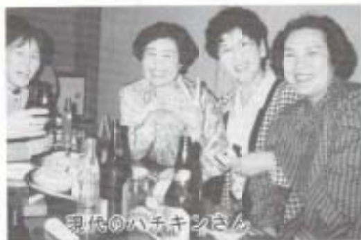
現代のハチキンさん

「アマシカウチ」という地名が、地検帳（長宗我部地検帳）にあります。「アマシ」に濁点を付けて、「アマジガウチ」とすれば、「尼寺ケ内」となり、尼寺があったことを表しているのではないのでしょうか。例の比江廃寺跡、土居