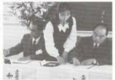
▲10月18日、土佐農業共済組合と大豊町農業共済組合が、来年4月の広域合併に向け、土佐農業共済組合会議室で予備調印を行いました。