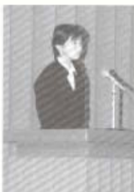
▲英語部員による英語でのスピーチ。日ごろの成果を発表します。

▼観客席も一体となって、すばらしい舞台発表が行われました。合唱コンクールの結果発表では最優秀賞のクラスから歓声が上がり、生徒たちの真剣な取り組みをかいま見たようでした。