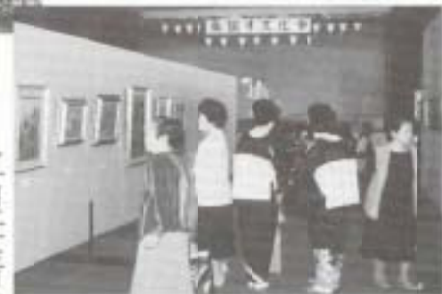
▶十月二十三日から三十日まで市民体育館、大豊公民館を会場に、南国市文化祭が開かれ、参加者は、展示に舞台発表にと練習の成果を登壇しました。