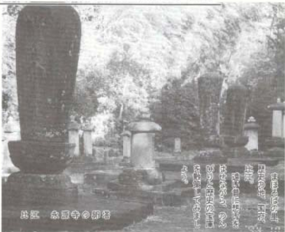
まほろばの里 国分・比江の遺跡 石の影刻 石の影刻は、 石の影刻は、 石の影刻は、

基作の千手観音である。林住職は静かな口調で広く知られている国分寺の歴史に加えて、知られざる国分寺の秘話も交えて話して下さる。国分寺は戦国の世に火にかけられ、たれていった時代もあり、また承応元年(一五五八)長宗我部国親・元親の父子が建立。また承応二年(一六五三)山内家二代藩主忠義が再興した東大寺型の寺院である。古文書によると、ある時、藩の重役からお城のつり鐘が破損したので新しく鑄造するまで国分寺の鐘を差し出せと命じている。かくして創建当時作られた梵鐘は一時大高坂城に移されたこともあった。現在の国分寺の鐘は、寺に鐘がなく、破小鐘を吊るしておけと付記した文書にはあきれられるばかりである。時代はさかのぼり紀貫之の記した土佐日記に「廿四日、講師馬のはなむけにいであせり」とある。講師とは国分寺の住職のこと、大津の舟戸で出津を待つ貫之のもとへ、特別に來ている。「いでませり」と敬語を使い講師の身分と交友の深さがしのばれる。