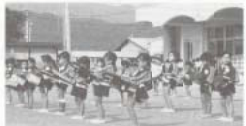
▲ひまわり幼稚園に幼年消防クラブが発足。日本防火協会からはっぴが送られました。

▲市内の菊愛好家で作る南国菊栄会が、市役所一階に南国市のマークを掲げた菊などを展示。また市内量販店などでも菊花展を開きました。