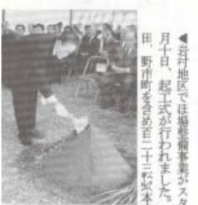
▲石井地区では塙整地事業がスタート。十一月十日、起工式が行われました。今後土佐山田、野市町をさきめ百二十三号は本市九十六号の区画整理が行われます。