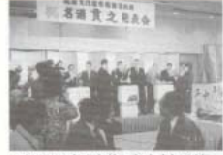
▲中の川の名水を使った本市初の地酒「貫之」が完成。11月4日、グレース浜すしでそのお披露目が行われました。