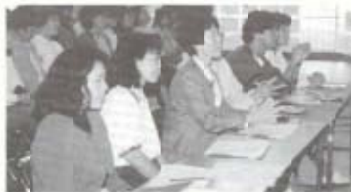
▲合唱コンクールの部員。熱心に歌う生徒たちを審査する目は、自然と真剣なものになります。

▼観客席も一体となって、すばらしい舞台発表が行われました。合唱コンクールの結果発表では最優秀賞のクラスから歓声が上がり、生徒たちの真剣な取り組みをかいま見たようでした。