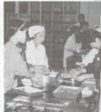
▶十一月四日、親から子に伝える伝統料理をテーマに「企業出前講座」(文部省補助事業)が都築訪産高田工場で行われ、生活改善グループの婦人らが女性従業員に郷土料理の指導をしました。

▼11月5日、中央公民館で、県内外の文化会館関係者をパネリストに迎え、文化会館建設に向けてのシンポジウムが行われました。