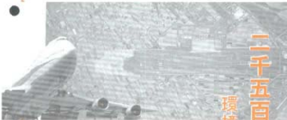
二千五百メートル国際空港へ