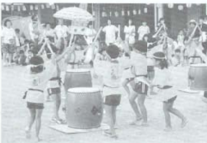
「エルマーとりゅう」のはっぴを着てはりきる園児たち。ポーズもさまになってるね。

一月に入って、市内の各保育所では夕涼み会が行われました。そんな中、八日に開かれたあけぼの保育所の夕涼み会では、シンボル「エルマーとりゅう」のプリントが入ったのはっぴとTシャツが登場。子供たちはそのはっぴを着て大喜び。 これは、保育所、保護者会、地区の老人クラブが中心になって作ったもので、三世代交流に役買いました。 会は、このはっぴを着た子供たちの踊りや力強い太鼓、保育さんやご家族の方の太鼓、また、昔ながらの紙芝居、自転車もやってくるなど、盛りだくさんの内容。夜店もたくさん出て、訪れた人たちは、暑い夏の日、ひんやりとした夕涼みを楽しみました。