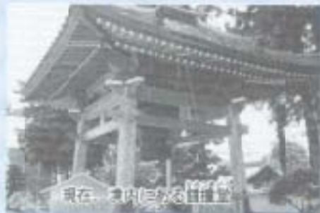
現在 境内に在る鐘撞堂