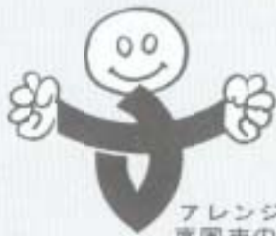
アレンジした南国市のマーク