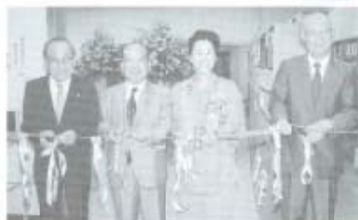
か以前金庫だった場所を「おはなしのへや」に改善。功見

これまでの市立図書館は老朽化が目立ち、危険な状態ということから今年三月に閉館。旧四銀銀行南国支店を借り受け、新図書館開設に向け進めていた内装工事が完了、七月五日にオープンしました。 この新図書館、一階の閲覧室には約二万五千冊を展示、二階は書庫として約二万四千冊を収蔵しています。このほ