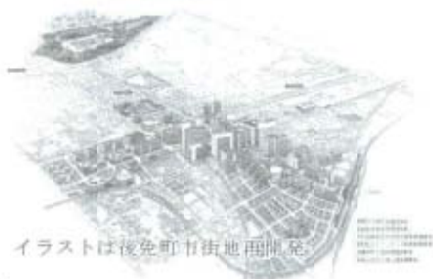
イラストは後免町市街地再開発