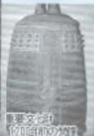
重要文化財 120年前の鐘

お寺の境内に鐘撞堂 かねつづまど というのはごく当たり前の光景ですが、国分寺には昭和52年まで鐘撞堂がなかったそうです。それ以前には仁王門 におうもん （当時鐘楼門 かねろうもん ）に梵鐘が掛かっていました。