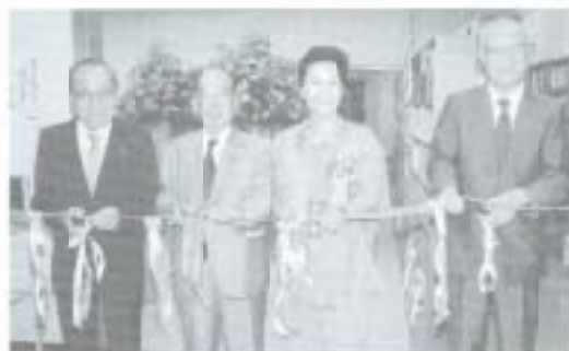
か以前金庫だった場所を「おはなしのへや」に改装、幼児

旧四銀南国支店で再出発 これまでの市立図書館は老朽化が目立ち、危険な状態といふことから今年三月に閉館。旧四銀南国支店を借り受け、新図書館開設に向け進められていた内装工事が完了、七月五日にオープンしました。 この新図書館、一階の閲覧室には約二万五千冊を展示、二階は書庫として約二万四千冊を収蔵しています。このほ