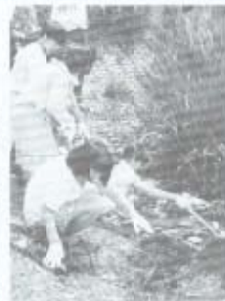
▲渡り鳥の飛来する十軒の石土道で、六月四日、釣り糸から野鳥を守ろうと、十市小児童や一般のボランティアアら約三百人がでて、釣り糸の回収清掃作業を行いました。

▼6月10日、「みどりの環境づくり」運動の一環として、香長中の生徒約100人が、片山の不燃物処理場コンメイヨシノなどの苗木70本を植樹しました。