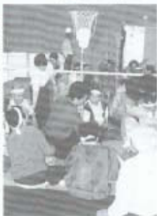
▶六月八日勤労者体育センターを会場に、リハビリ教室のミニミニレクリエーションが行われました。これは、年二回行っている戸外リハビリの一環として行われたもので、参加は教室生、保護者ら三十人は、風船バレーや主人入れなどの競技を、和気あいあいと楽しんでいます。