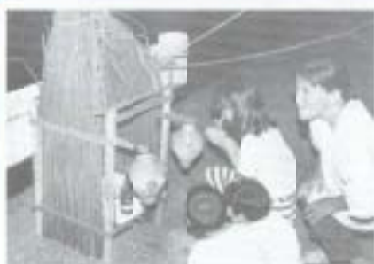
▲南国市の初夏の風物詩となったエンコウ祭り、6月4日前派、久枝の後川、秋田川で行われ、子供たちは木の事故がないようにと、ショウブの葉で作った社に手を合せました。