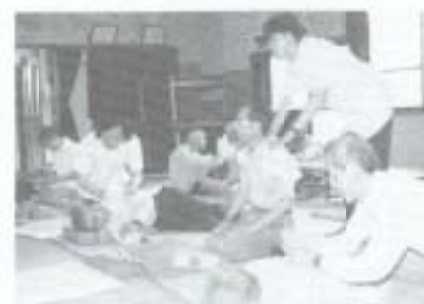
▶五月二十三日、岩村公民館で真立盲学校赤十字治療奉仕団によるあんま・マッサージ奉仕が行われました。これは、日本赤十字岐阜支部が行っている一日赤十字事業の一環で、お年寄りらは大変喜んでいました。