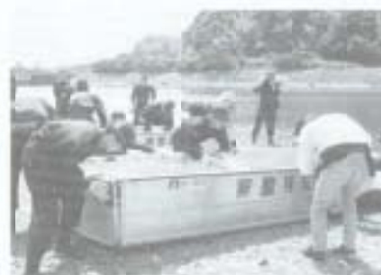
▲水のシーズンを迎えようという6月15日、国分川で消防署、警察署合同の水難者救助訓練が実施され、救助資機材を使った訓練や、人工呼吸法などが行われました。

▼平成14年の高知国体に向け、5月28日、初の準備会が保健福祉センターで開かれました。この会では準備委員会を設置して、誘致種目や選手強化策の検討することを決めました。