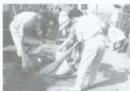
▲6月5日に行われた市内一斉清掃では、朝早くから多くの市民の方が汗を流しました。