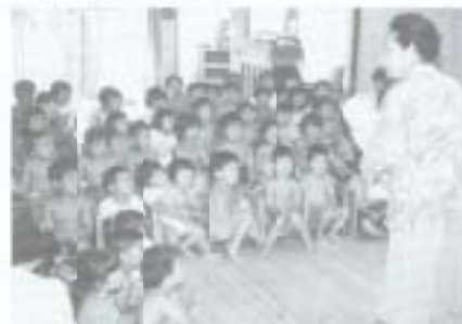
▲人権擁護委員の日の6月1日、浜改保育園で啓発活動が行われました。同委員によるいじめを無くそうという話に、園児たちは熱心に耳を傾けていました。また、園児全員に風船のプレゼントがありました。