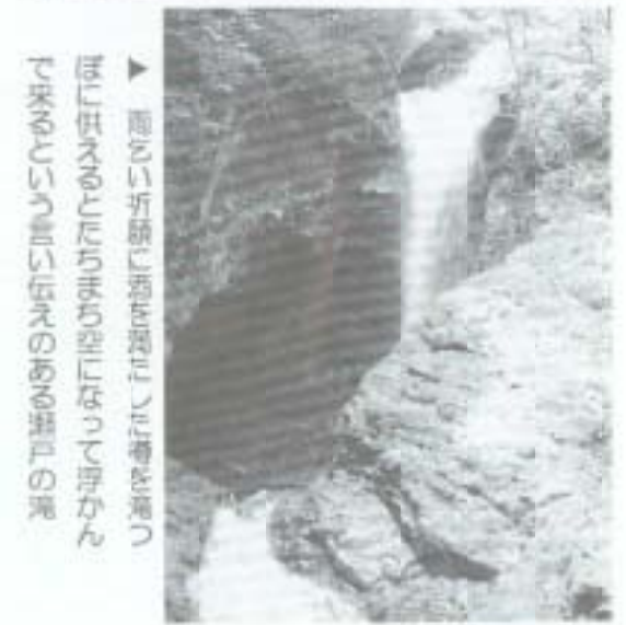
▲ 黒滝の折戻り滝は、昔は「供えのたまたまちきり」になって浮かんできたといわれている滝の源