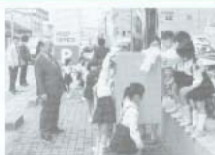
▲4月21日、通区記念日を祝い、大町市長が南国郵便局で1日局長を勤めました。写真は、郵便ポストの清掃をするひまわり幼稚園の子供たちに声をかける大町市長。

四月二十二日、日本赤十字高知県支部が、日赤南浜分区分にタンカや救急箱など、国府分区分に救護用テントを配置しました。 これは、地域の赤十字活動を推進するため、日赤高知県支部が平成四年度より各分区分に活動資機材を配置するという趣旨で行われている活動の一環です。