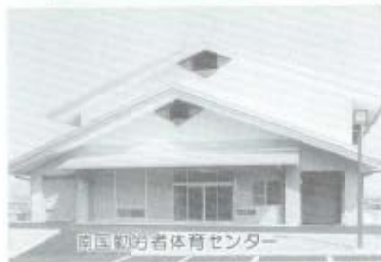
南国勤労者体育センター

(使用許可申請書は、体育センター・市商工水産課にあります。) ※使用料などお問い合わせは商工水産課(☎2111内線361)まで。