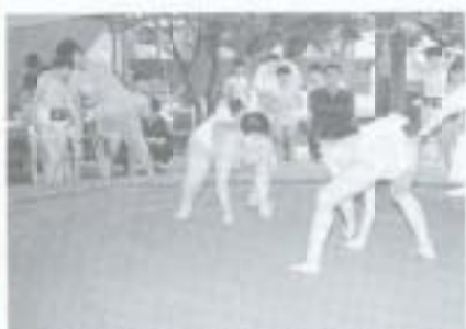
▲5月15日、市民体育館相撲場で、大徳祭わんぱく相撲大会が開かれ市内から7チーム30人が参加。あいにくの雨にもかかわらず、土俵の上では熱い戦いが繰り広げられていました。

四月二十五日、米消費拡大事業の一環として、国府小学校の児童が田植えをしました。ふたんできない体験に子供たちは大喜び、泥水の冷たい感触を味わいながらの楽しいひとときを過ごしました。