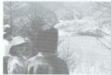
▲大森山のふもとからは奈路を一望できます