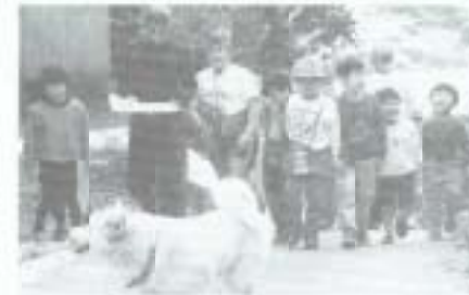
▲「ここはぼくの庭だワン！」 ワンちゃんに道案内をされて探検団一行は出発。