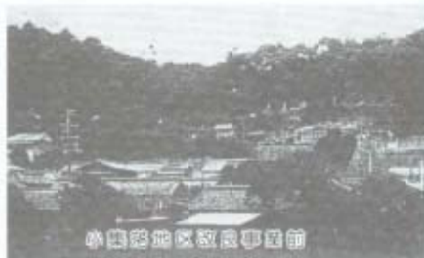
小国地区改良事業前