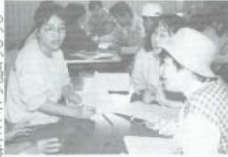
▲めいめいが自分の気に入った場所を提案

めいめいが気に入ったことを書きこめ、公民館に集った一行は、三つのグループに分かれ、宝物集め(良かった点)、問題点集め(良くない点)を、その結果、奈路地区の誇れる点は美しい自然、美しい風景、石垣など風情のあるたずまわいが残っている点などでした。また、問題点に川がコンクリ