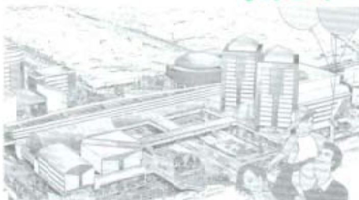
イラストは高知駅周辺再開発