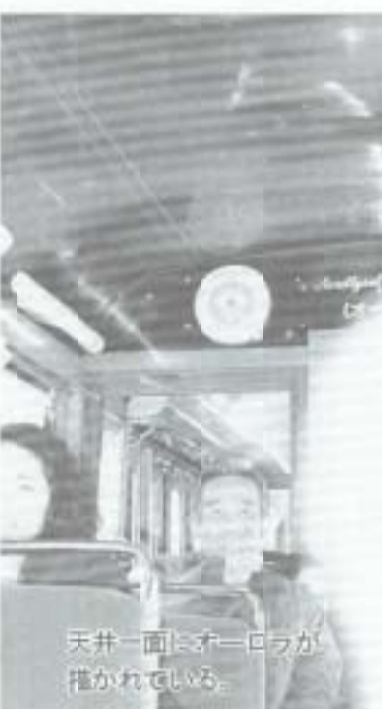
天井一面にオーロラが描かれている

バスと違って座席が向かい合うので、乗りあわせた人を見渡し、まず知人がいないか探します。景色をながめながら仲間の人とおしゃべりするのには楽しい。今の若い人の服装や髪型、持ち物、流行はどんなものか観察もできるのが電車のいいところです。お年寄りが、電車の料金が無料の日に後免から伊野まで乗って、保養センターでのんびりして帰るという話を聞いたことがあります。ちょっとした電車の旅ですね。