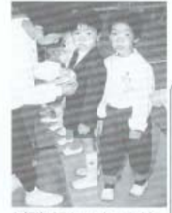
上級生のおにいちゃんが胸にリボンをつけてくれました。

今年も入学シーズンをむかえ、市内でもたくさん的一年生が誕生しました。幼稚園、保育所から、大学、会社まで期待と不安に満ちた新しい生活がスタートしました。 そんな中、四月七日、白木谷小では八人の新入生を迎えました。