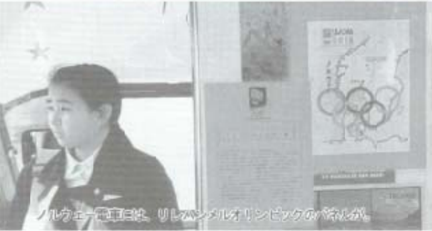
ノルウェー電車には、リレハンメルオリンピックのポスターが

上手にとびまわりを歩いているのね、とびつくりしています。列ってない田んぼの稲穂もあるし、学校も見たりでちゃんちん電車といって大喜びでした。また、七・八年前でしたか小学四・五年生の遠足の電車に乗りあわせました。窓から外を見ながらみんな大はしゃぎです。一人の生徒が「高知城東病院がある」と言ったのでびつくりして、「おぼろやんは高知城東病院と読むけど」と言うのと、四・五人が「ぼくら高知城東病院と読む」と言いました。高知城が観光名所としてあまりにも名高いものだからかなと、おもしろく、子供から読み方を習ったような気がしました。