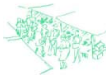
▲土曜市 (後免東町電停南へ徒歩約5分) 朝早くから買物客でにぎわいます。

路面電車がわが国で初めて走ったのは京都であるが、高知では明治三十七(一九〇四)年五月二日に、全国で十番目になる本町線、潮江線が開通し、初めて土佐路に路面電車がお目見えした。土佐にはぐくまれた自由民権運動に見られる進取の気性と、当時高知で活躍していた政財界人の先見の明(めい)と努力によるものであった。 順次東に延長してきた軌道は、明治四十四(一九一一年)五月十四日、遂に後免町東町まで複線で開通した。これより先一月二十七日に大津、後免中町が開通し、二月十一日の紀元節(現在の建国記念の日)に、大塚の長岡郡役所北側で開通式が行われた。 はりまや橋を跨いで島橋を渡った電車が高須村、大津村(現高知市)を経て、大藤村、後免町(現南国市)へ人々と共に文化の薫りを運んでくるようになった。また近代化の進む高知市へ、人々は車窓に広がる香長平野、舟入川、国分川の風景を楽しみながら、出掛けるようになった。