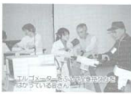
エルゴメーターをふりて体力測定をはかっている皆さん。