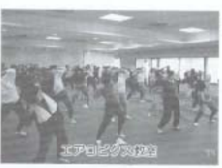
エアロビクス教室

現在三百四十一人の方に挑戦していただいております。もうすでに中間点に到達した方も六人(三月八日現在)もおられます。 競い合いではありません。楽しみながら、でも少し頑張