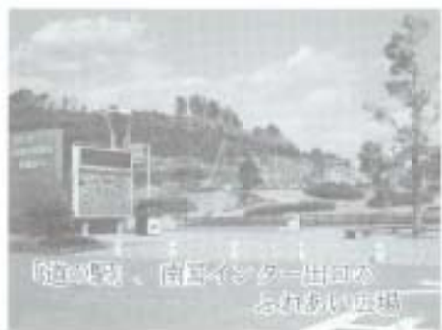
南国インター出口の展望

で結ばれ「地方の時代」も東京対地方の図式から「地方分権の時代」を迎えて地方と地方が協調しながら、競争・競争していく時代になろうとされています。