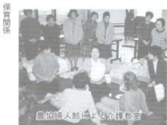
農協婦人部による介護教室

このため、健康観に関する市民アンケート調査を基に、「市民一人ひとりの心身の健康づくり」、「自然とまちの健康づくり」、「市民の気持ちの健康づくり」を三つの目標に計画を策定しているところです。