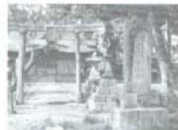
▲田吉神社 後免町創立記念碑が神社南方公園内にあり。