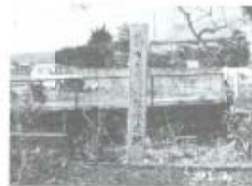
▲源希義戦死の地 (舊ヶ池中正門北側) 源頼朝の弟、頼朝に呼んで平氏討伐の兵を擧げるが、やむなくこの地で戦死。