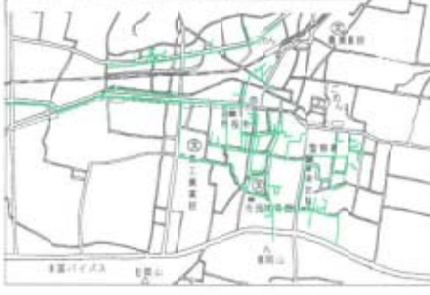
色刷り部分が配管工事が完了しているところ

受益者負担金の賦課と納付 下水道への接続可能な区域（供用開始区域）は、今年度約八割を追加し、約四十八haとなりました。 新たに供用開始区域になった土地は、資産価値や利用価値などが増大します。