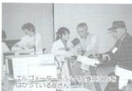
エルゴメーターをふりて体力測定をはかっている皆さん。

けて、その一環として「来たるべく本格的な長寿社会を健康で活力あるものにしていくために、市民一人ひとりが、栄養、運動、休養のバランスのとれた健康的な生活習慣を