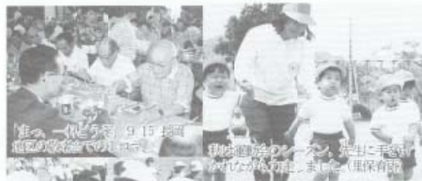
11月 一人ひとりの笑顔が溢れる学校行事