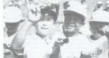
大きくなったらまた南国市に来てね。浜改田の海亀無事にお化。十市小の子供たちが放流しました。