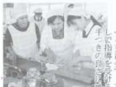
十月十三日、高知農業高校で行われた「おいしくお米を食べる交流会」。真剣なまなこで指導を受ける高校生の、手つきの良さを感心しました。