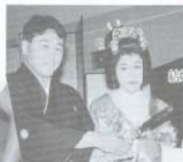
結婚シーズン。今年は何組がゴールイン？