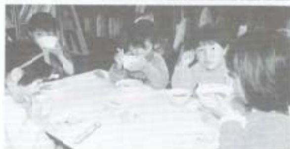
自分たちで作ったおそばの味はどうか？

「おかわりーっ！」 なかなかおいしかったよって、おかわりが続出。みんなの評判は良かったようです。