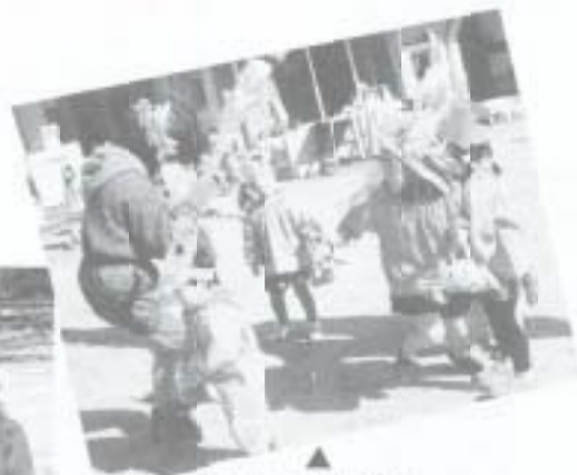
「ワッ！おにだ」 豆を投げておにをやっつけちゃえ

2月3日、国府保育所では子供たち全員が参加して、節分恒例の「豆まき」を行いました。みんな、ちゃんとおにを退治できたかな！