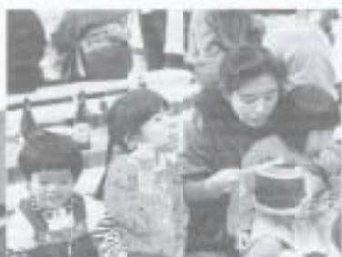
11月11日 本谷村龍馬祭。竹のおわんに入ったしゃも鍋をほおぼる親子、おいしかったかな？