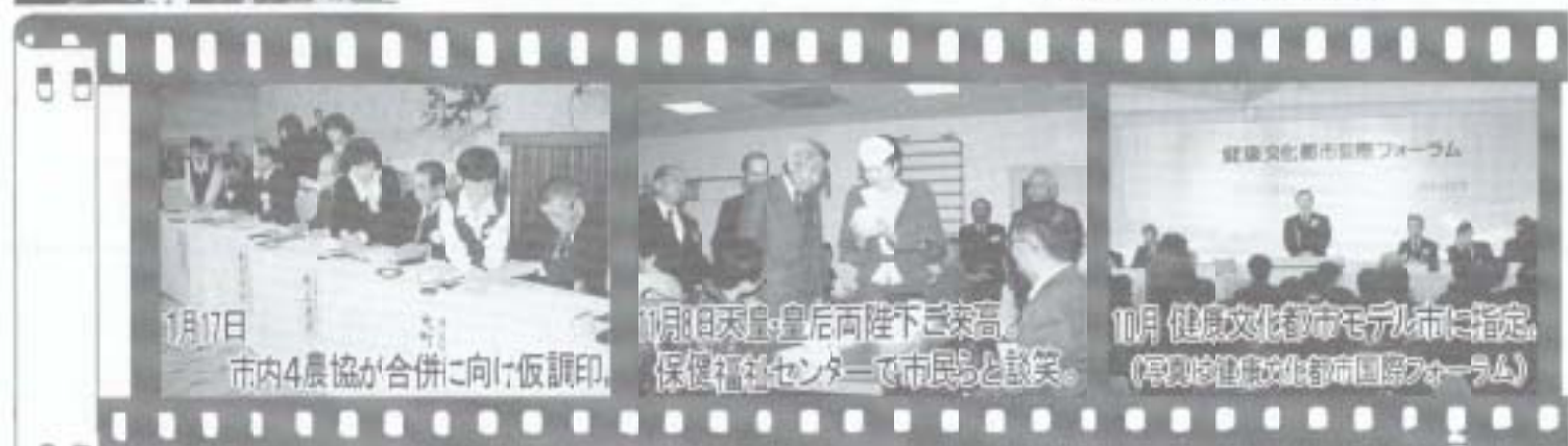
1月17日 市内4農協が合併に向け仮調印。