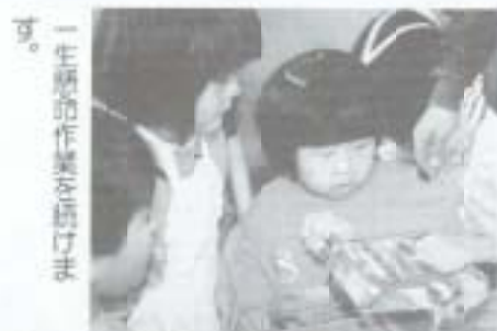
一生懸命作業を続けます。