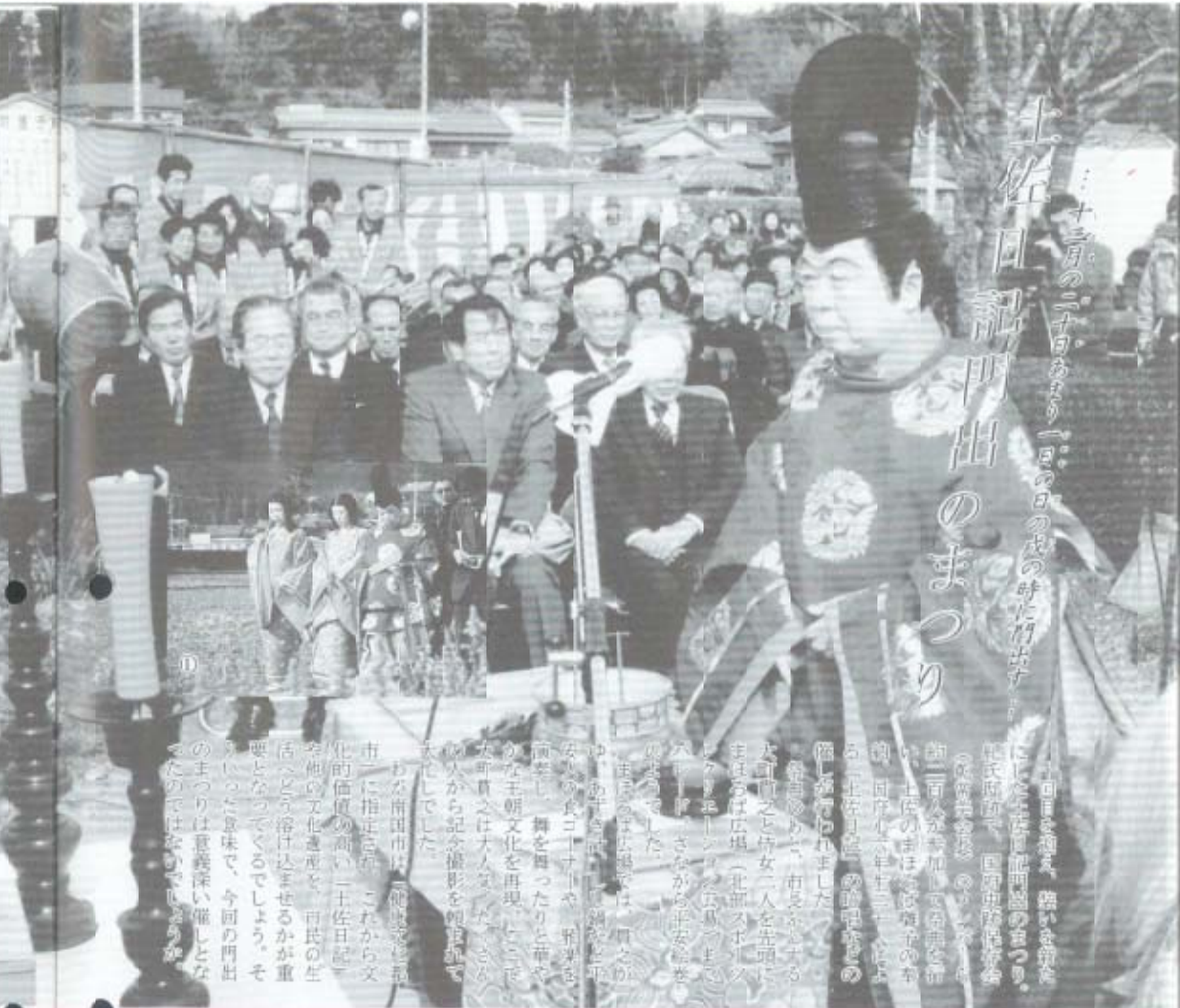
土佐日記門出のまつり 土佐日記門出のまつり。土佐市で、国府史跡にちなんで、土佐日記門出のまつり。土佐市で、国府史跡にちなんで、土佐日記門出のまつり。

土佐日記門出のまつりでは、国府史跡にちなんで、土佐日記門出のまつり。土佐市で、国府史跡にちなんで、土佐日記門出のまつり。