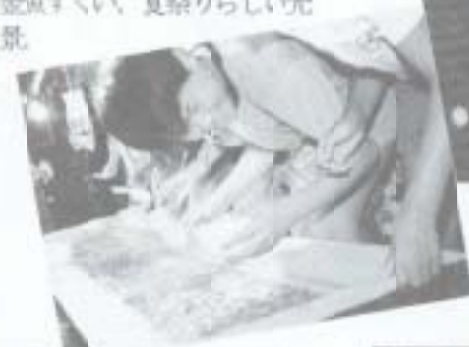
「まかいちよけや！」 7.20 片山天満宮宵祭り。金魚すくい、夏祭りらしい光景