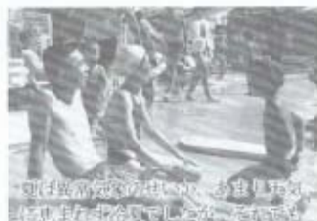
夏(長高祭)のせい、おもしろいと思えたお祭りでした。その後も晴れ間が広がった日には、巨峰園も家族連れらでにぎわいました。