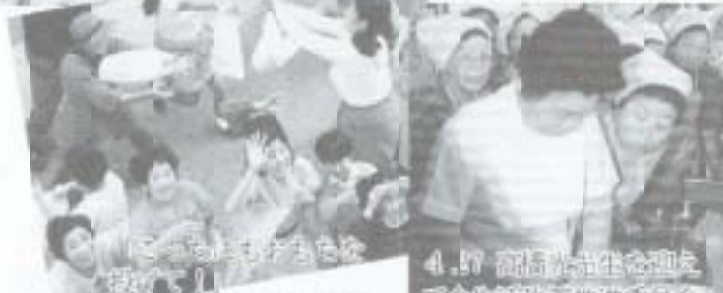
4.30 高齢者多世代交流プラザ落成式で。

姉妹都市提携20周年記念事 各地域のちょっとした出来事ま そんな催しでのスナップ、また、 なさんの顔を紹介します。