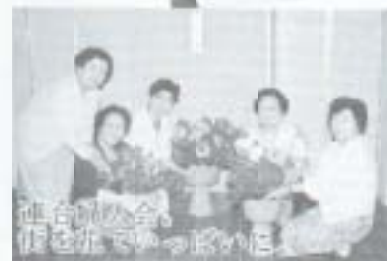
進合開会。僕も元気でっかいに。