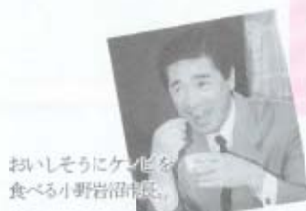
おいしそうにケイ化を食べる小野岩沼市長。