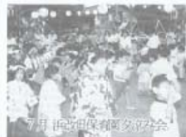
7月 浜改田保町交差点