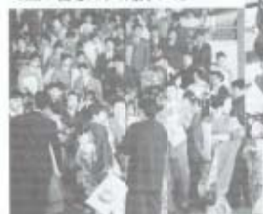
1.15 成人式。若者のパワーに圧倒されました。これからの南国市を背負って立つ皆さん、成長って。