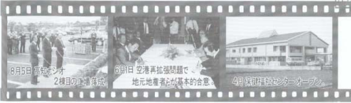
8月5日 高知ガジョ 2棟目の工場落成。