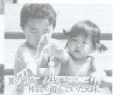
夏の初め、7月毎年で、仲良く遊んでいた元は。