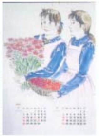
▲『一九九三年カレンダー』 川久保尚亮