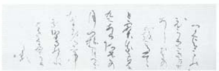
▲『月によせる歌二首』 溝淵清琴