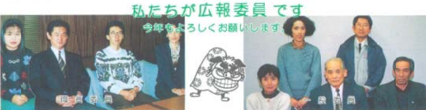
私たちが広報委員です 今年もよろしくお願ひします

議長 南国市は学園都市でもあります。高知医科大学、高知大学農学部、そして皆さんの高知工業高等専門学校、高等学校、農林業技術センターなど高等教育機関や試験研究機関の集積があります。すばらしい人材育成の機関が揃っているわけですから、受け皿となる優良な企業の立地が大切ですね。 とりわけ若い人たちに人気のあるソフトウェア、コンピュータ、デザイン、設計などの企業を誘致したいですね。