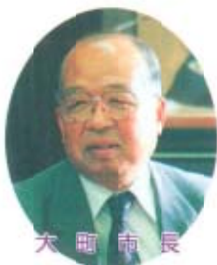
大 町 市 長

司会 あけましておめでとうございます。 新春座談会は、二十一世紀の夢ある南国市を創造してみたいと思います。最初に市長・議長さんの新しい年にあつての抱負をお聞かせください。