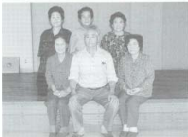
今回は後免中町公民館で活動している「日本画教室」におじゃましました。