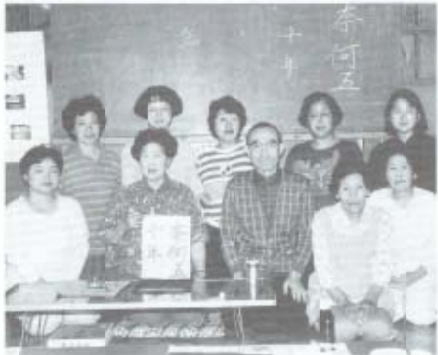
今回は相生公民館で活動している「習字クラブ」を紹介しませう。