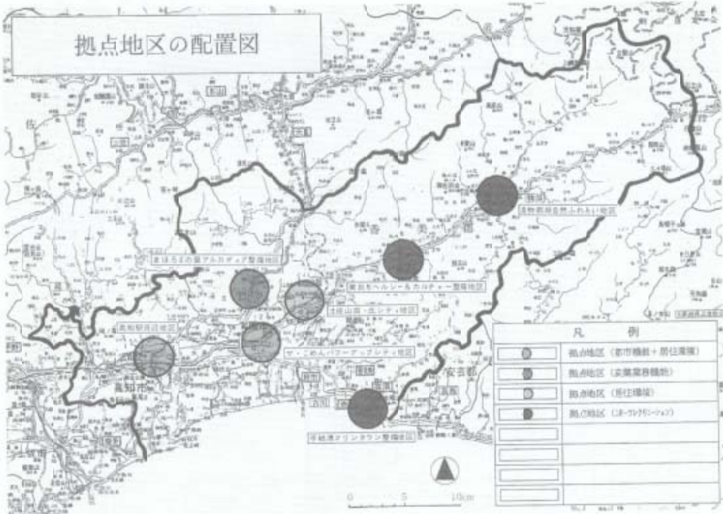
拠点地区の配置図