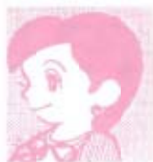
基盤整備の基・救世主

あやちゃん・地方拠点都市の第一次指定、おめでどう。まもる君・全国十四地域の「優等生」に選ばれたわけだから、市民と共に喜び合いたいね。