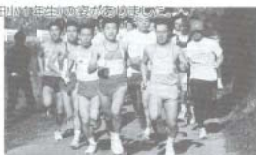
岩原松兄さん・白木谷