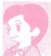
個性キラキラ ネットワーク