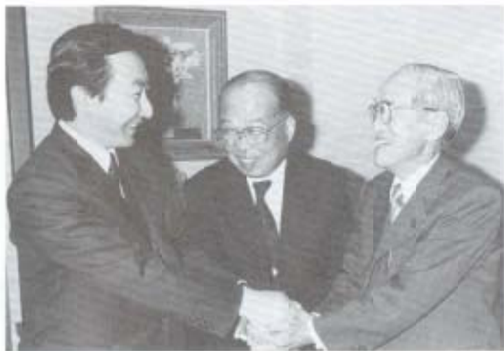
第1次指定の朗報に握手を交わす左から橋本知事、大町南国市長、横山高知市長（平成4年12月10日、知事公邸で）

いよいよ「ほんごく・こうち地方拠点都市」の幕開けです。激しいサバイバル競争を見事に勝ち抜いた第一次指定ですが、指定が目的ではなく、パブル崩壊・不況という行財政環境の制約のなかで、指定のメリットをどのように生かすかが最大の課題です。人口十万人の副都心、南国市建設、興勢浮揚をかけた正念場。拠点元年のスタートです。市民パワーを結集していきたいものです。