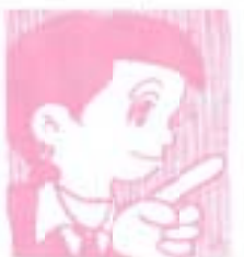
2月末までに基本計画

あやちゃん・事業計画の熱度は全国でもトップクラスだったとか。まもる君・県や関係市町村の職員がよく頑張った結果だね。特に、通産省のオフィス、