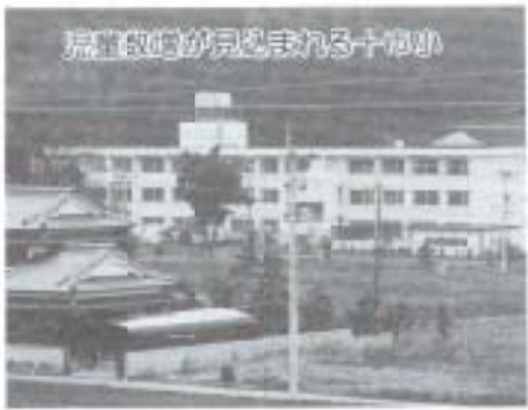
児童数が増える小学校

下田川の河川改修工事に伴 うグラウンド用地の確保につ いては、県とも話し合い、地 権者、地元の方々の理解と協 力を得て、学校としてのグラ ウンド機能を充実するように 用地の確保に努めていきたい と思います。