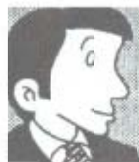
海・山・川の レクリエーション

担していくことが大切ですね。まもる君・高知市には都市的なサービスのニーズに応えてもらうため、高次の都市機能をより一層高めてもらおう。つまり、鉄道高架による南北交通の円滑化、高知駅周辺の市街地再開発で新たな都市拠点をつくり、中核都市としての機能を高めてもらうこと。