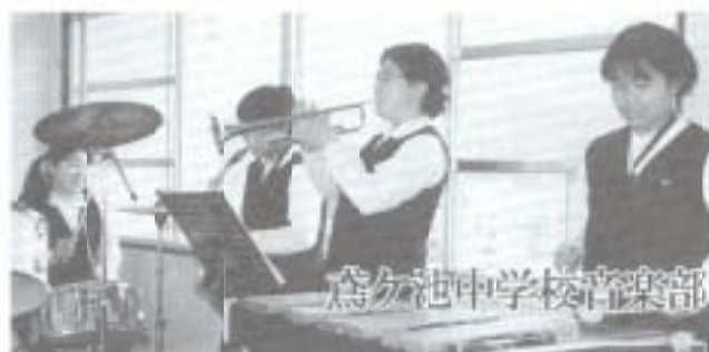
為分池中学校音楽部

淡路島にみんなで一緒に旅行に行きました。お船に乗ったし、コアラもいたし。海のみえるでっかいホテルに泊まって、でっかいお風呂に入りました。ちゃんとお風呂に入らなかったの、お父さんに怒られました。