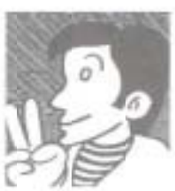
医大周辺を学術都市に

まりちゃん・JR、くろしお鉄道、土佐電鉄との結節機能を生かした後免町周辺の再開発も緊急の課題ですね。 おさむ君・土電の後免町駅には阿佐線の開通に合わせて「はらたいたらと世界のオルゴール館」「ショッピングタワー」の計画もある。 まりちゃん・ドイツやポルトガルの世界の電車を走るんだってね。