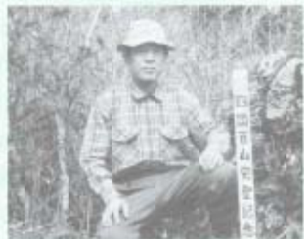
百山を完登し人生の節目にすることができた。

最初のうちは不安で中間と一緒だったが自信がつくと自分のペースで登りたくなった。最近ほとんどカメラ片手に単独行動である。山頂での記念写真、山の魅力あふれる風景を写している。アルバムに整理し、思い出しては見るのが楽しみにしている。五年の歳月を経て、ついに