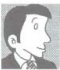
広域交通の拠点都市

おさむ君・南国市は優れた立地ポテンシャルを持っています。立地条件や潜在的な能力は抜群なんだから、今こそ攻めの姿勢を發揮してほしいところだよ。子や孫の時代に、胸を張って誇りにできる南国市の基礎づくりが副県都構想なんだ。