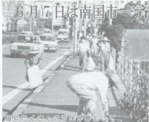
毎年たくさんの方が参加して