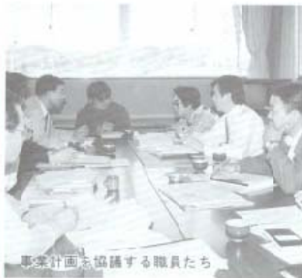
事業計画を協議する職員たち

公共下水道は、生活環境の整備と公共用水域の汚濁防止に欠かせないもので、普及率は、都市近代化のバロメーターともいわれています。現在供用中は、高知市、伊野町、夜須町だけで、普及率も全国平均40.0%に対し、県平均は、8.7%とまだ低率です。このたび、本市におきまして、供用開始となりました。これまでの間協力を頂いた、市民の皆さん、関係者に深く感謝するとともに、一日も早く多くの市民の方に利用していただきたいと思っております。今後とも、副県都にふさわしい下水道の普及促進に努め、地域住民の皆さんの住みよい生活環境のため、職員一丸となって職務にあたります。