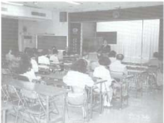
四月七日の開講式

◆ ◆ ◆ 今回は中央公民館のサークル活動のうち、今年から新しく始まった「話し方教室」におじゃましました。