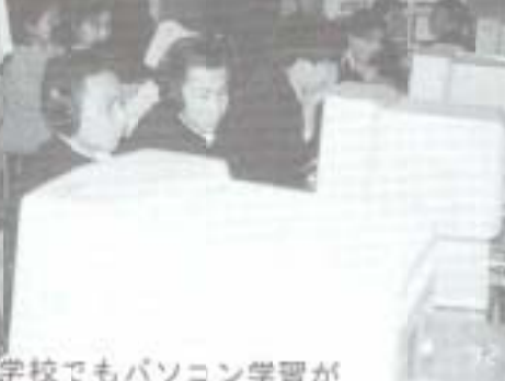
中学校でもパソコン学習が

点としていく。 問：健康カードの導入については、以前の質問では時期尚早とのことであったが、高齢化社会を迎え、自分の健康データを管理するシステムにぜひ必要と考えるが。 答：国も関心を持っていると聞くので、検討してみたい。 問：市費のいらぬような例えは郵政省の資金による保養センターのようなものも誘致してはどうか。 答：積極的に考えていきたい。