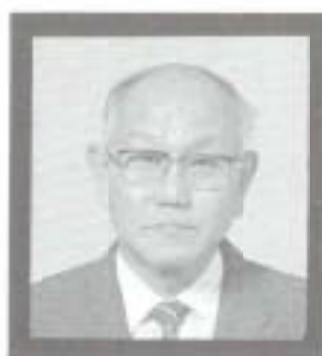
（六十九歳）が、三月十二日、