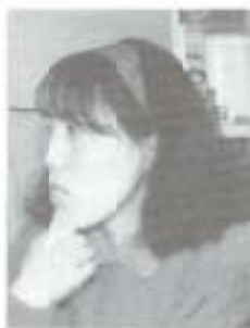
市主催の英会話講座に受講した三人インタビュー。

週二回、好きな時間に来て、二時間ほど汗を流して帰ります。ここには友人や若い人もいますから、おしゃべりするのを楽しんでいますよ。車の運転をしているので、反射神経の老化防止にも役立ちます。 孫も学校でしているので、いつかプレーがしてみたいと思っています。