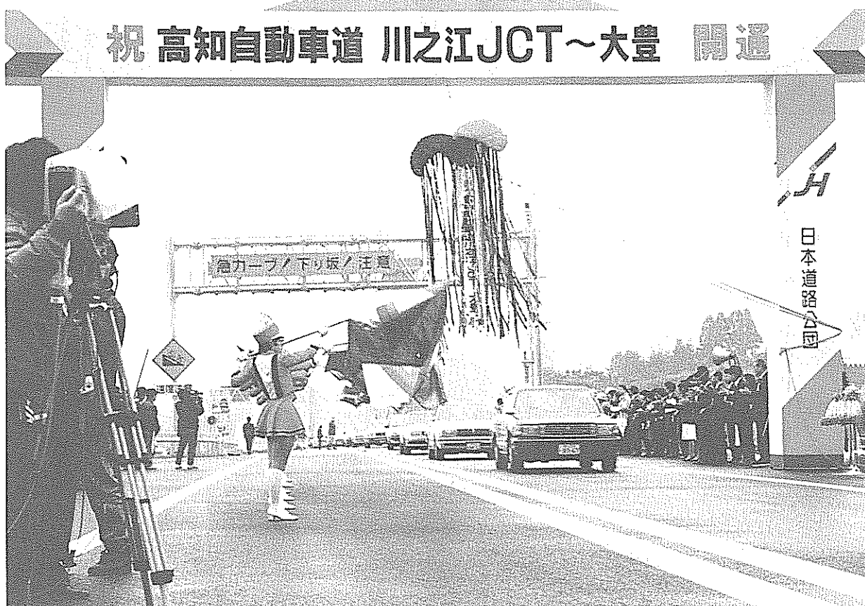
南国－川之江－直線!! (1月30日開通)