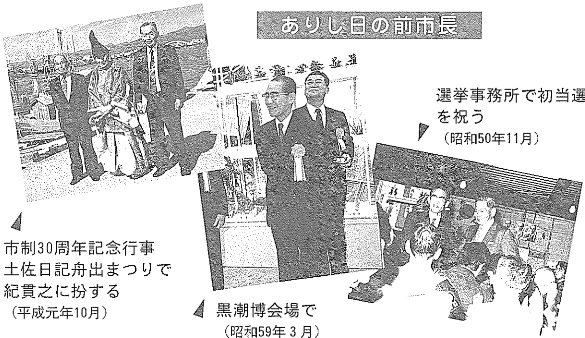
選挙事務所で初当選を祝う (昭和50年11月)