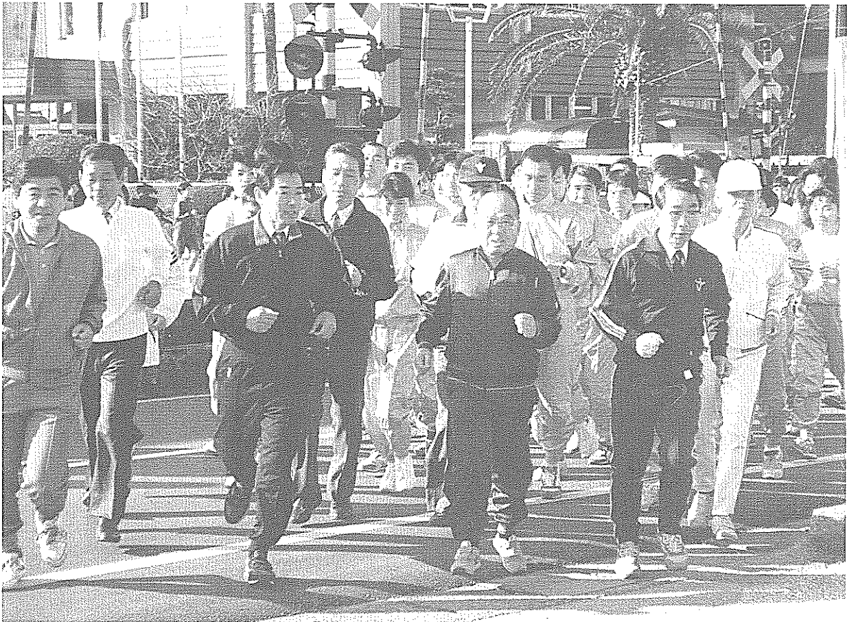
1992年を駆け抜けよう!! (南国市体育始め)