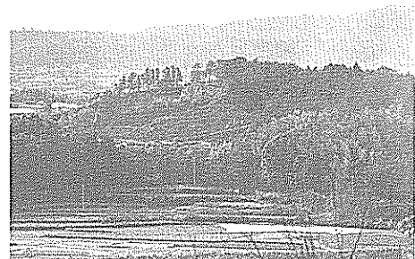
ハイテクパーク予定地

のしないものにするため、高知市のもの三倍位の規模にしたい。千台位収容出来る駐車場が必要で、敷地面積も三・三秒くらいで考えている。南国市民だけが享受するものという考えでなく、広域的な住民が恩恵を受ける施設であり、そのため、建設位置をどこにするのが早急な課題だ。広く市民に意見を求めたい。