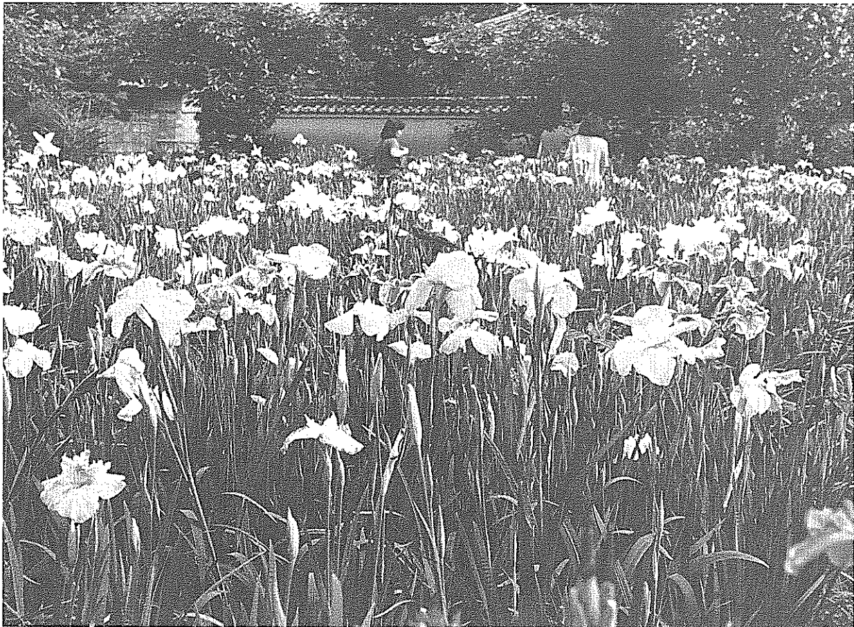
初夏の彩り(篠原のしょうぶ園)