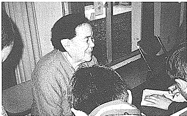
織字学級で学ぶおばあちゃん

のでしようか。明治政府は「解放令」は出しましたが、部落差別を根本的に解消する意図など全くなかったのです。その証拠に、明治新政府は、解放令を出す前の明治二年に、皇族・華族・士族・平民という新しい身分制度をつくっていますし、また、明治五年の近代戸籍には平民という身分のほかに「旧えた」「新平民」などという差別的な用語をわざわざ記入しています。これが後々までも差別を残す大きな要因の一つになりました。