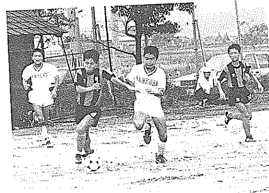
韓国安山市と南国市の中学生がサッカー交流