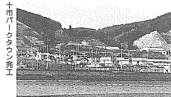
十市パークタウン完工