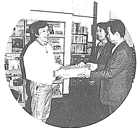
市立図書館の貸し出し冊数が50万冊に