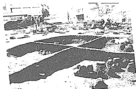
県下最大級の東崎遺跡