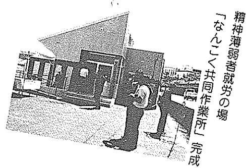
精神薄弱者就労の場「なんこく」共同作業所」完成