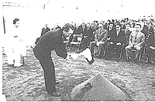
高知カシオ起工式