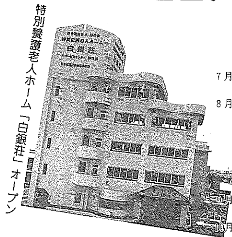
特別養護老人ホーム「白銀荘」オープン