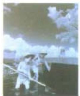
写真「夏の日」松本昌博