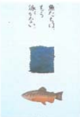
デザイン「自然保護ポスター」渡辺雅子