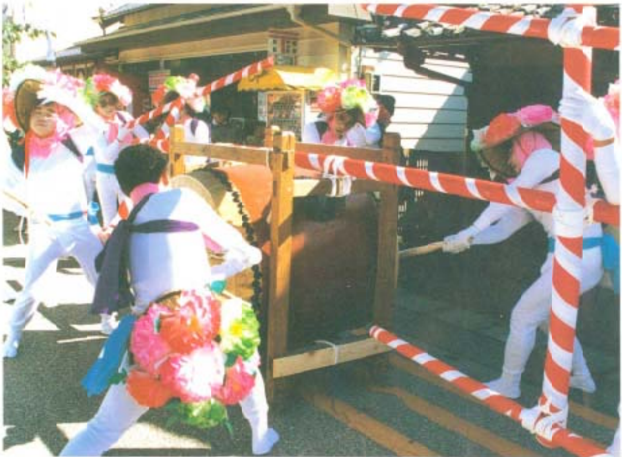
「ソーレノ」勇壮におなばれ(伊都多神社秋祭)