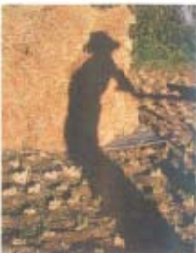
写真「夏の日」山本十三子

「純せい（シャイプール）」唐岩薫夫（白木谷）、 「絵巻」杉本孝一（立田）、 「特等席」木戸誠古（明見）、 「マイファミリー」西内誠一（金地）、 「ごらんご祭り」三田分、 「ジャンプしたカモメ」野村博之（物部）