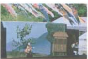
写真「野外劇場」田島一美