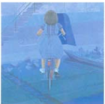
洋画「筒井広道」岡林光山

洋画「筒井広道」、日本画「岡林光山」、書道「兵田司川」、漫画「平井まさね」、デザイン「仲藤三、彫塑・工芸「石川玄宏」、写真「田口吉明、宮内巖」