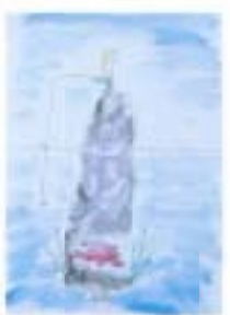
漫画「レジスタンス」古谷栄幸