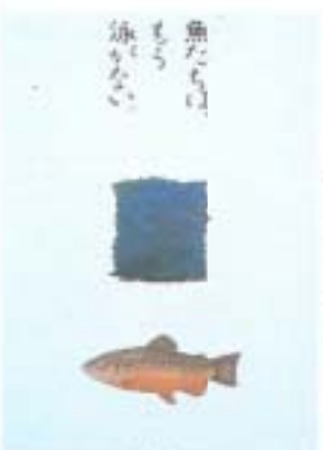
デザイン「自然保護ポスター」渡辺雅子