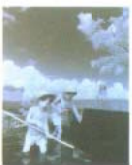
写真「夏の日」松木直博