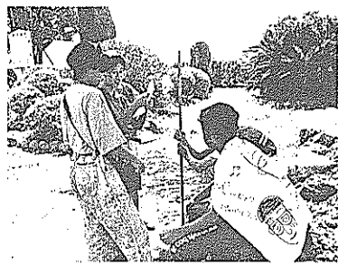
みんなで協力して関門をクリア

四日間の短い交流でしたが、両市のジュニア・リーダーは、互いに刺激し合い、一致協力す