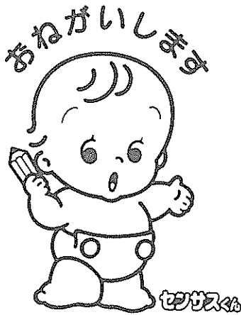
昭和60年国勢調査 年齢別人口

10月1日は5年に一度の国勢調査。赤ちゃんからお年寄りまで日本に住んでいるすべての方が調査の対象となります。世帯ごとに調査票を配布します。一人暮らしの方は、未成年でも世帯主。漏れなく、ご記入ください。