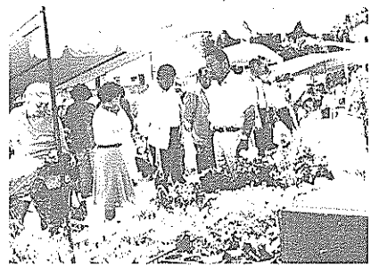
足をとめて花に見入る買い物客

この日の祭りは、同土曜市が四月に法人化して、第一回目のイベントで、愛媛県広見町から姉妹市の近永日曜市も友情出店。七十余りの店には、色とりどりの鉢植えや季節の果物、野菜、魚が並びました。 午後九時の開場とともに、サツキやシントウの苗などが無料配付されましたが、あっとい