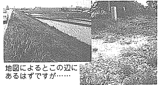
地図によるとこの辺にあるはずですが……