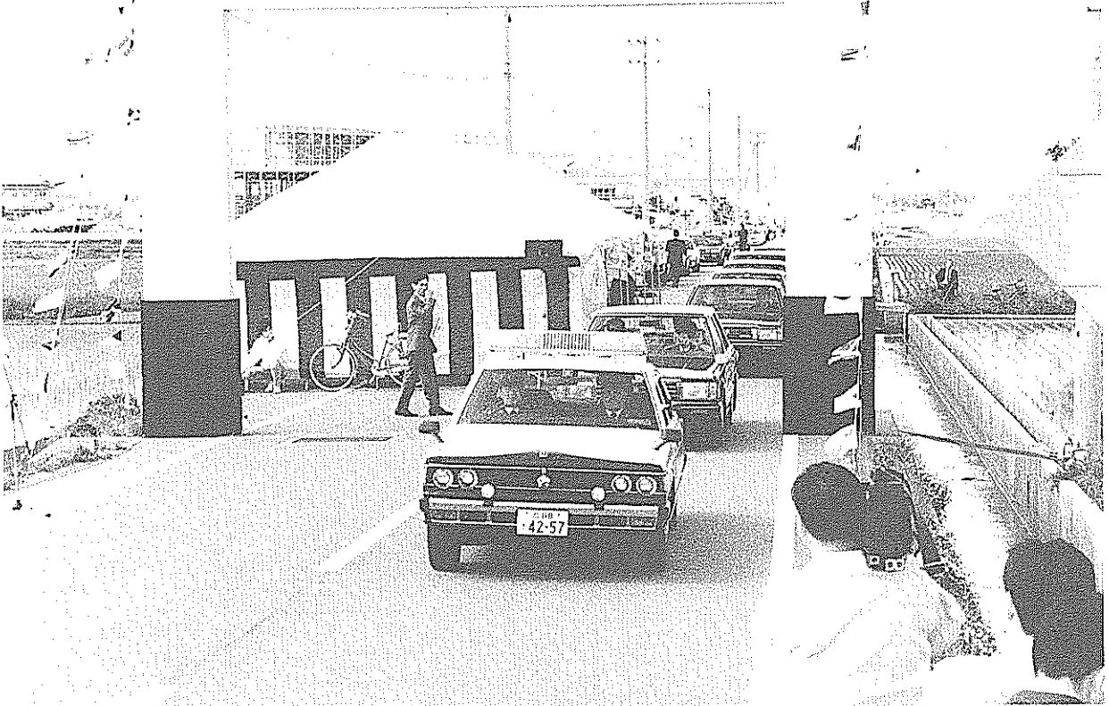
市を南北に結ぶ待望の広域農道全線開通（5月8日）