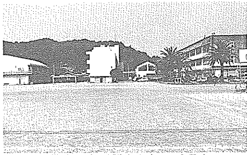
環境悪化が懸念される香長中

□公教育である学校は、法的拘束力を持った学習指導要領に沿った教育を行う責務があると考える。国旗、国歌は未来に向けての平和国家のシンボルとして正しく理解し、誇りを持つとともに他国の国旗、国歌に対しても尊重する心を育てなければならぬ。各学校では校長の責任において適切に取り扱われると期待している。