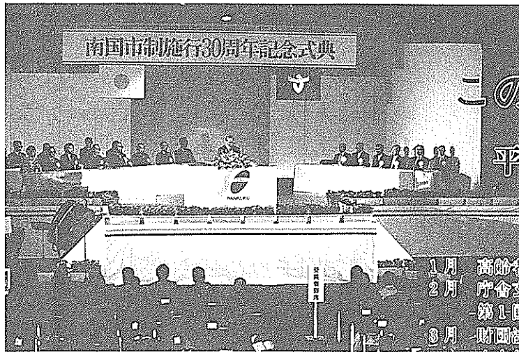
市制施行30周年記念式典