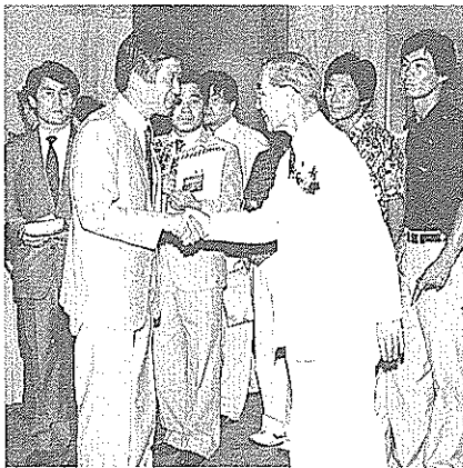
安芸市長(中央左)と市長ががっちり握手(市民の翼)