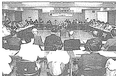
活発に意見を交換したまちづくり研究交流会