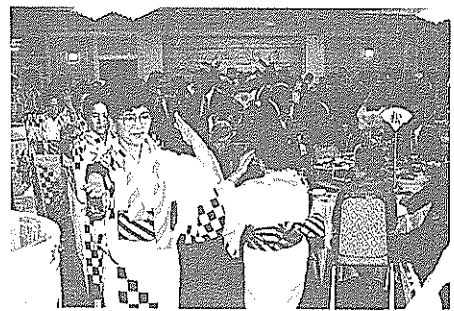
南国市音頭で祝賀会を盛り上げる