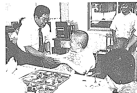
希望の家に新米のプレゼント

り出し日に毎年行われているもの。会場では、市農協婦人部や米消費拡大推進連絡協議会の皆さんが、おにぎりや菜飯などを作って、会場を訪れた人に試食してもらい、新米のPRをしていました。