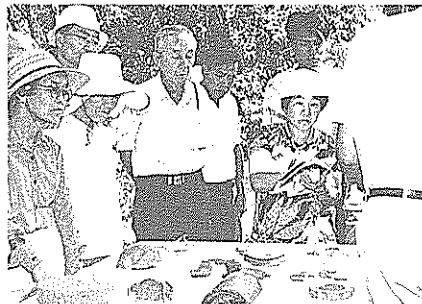
出土遺物の説明を受ける参加者

この交換学生は、高校生一人をはじめとする四人の皆さんで、南國、岩沼両ライオンズクラブが昭和五十五年に姉妹クラブ提携を行ったのを記念して、姉妹