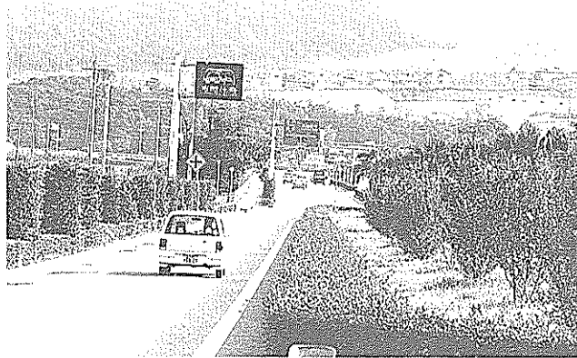
高知東部道路とは潮見台の南側で接続

浦戸東部道路（高知東部自動車道）をはじめとする都市計画道路の計画決定のための説明会が、このほど行われることになりました。