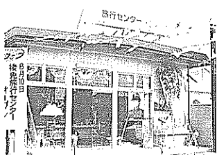
駅舎の東側に設置された旅行センター