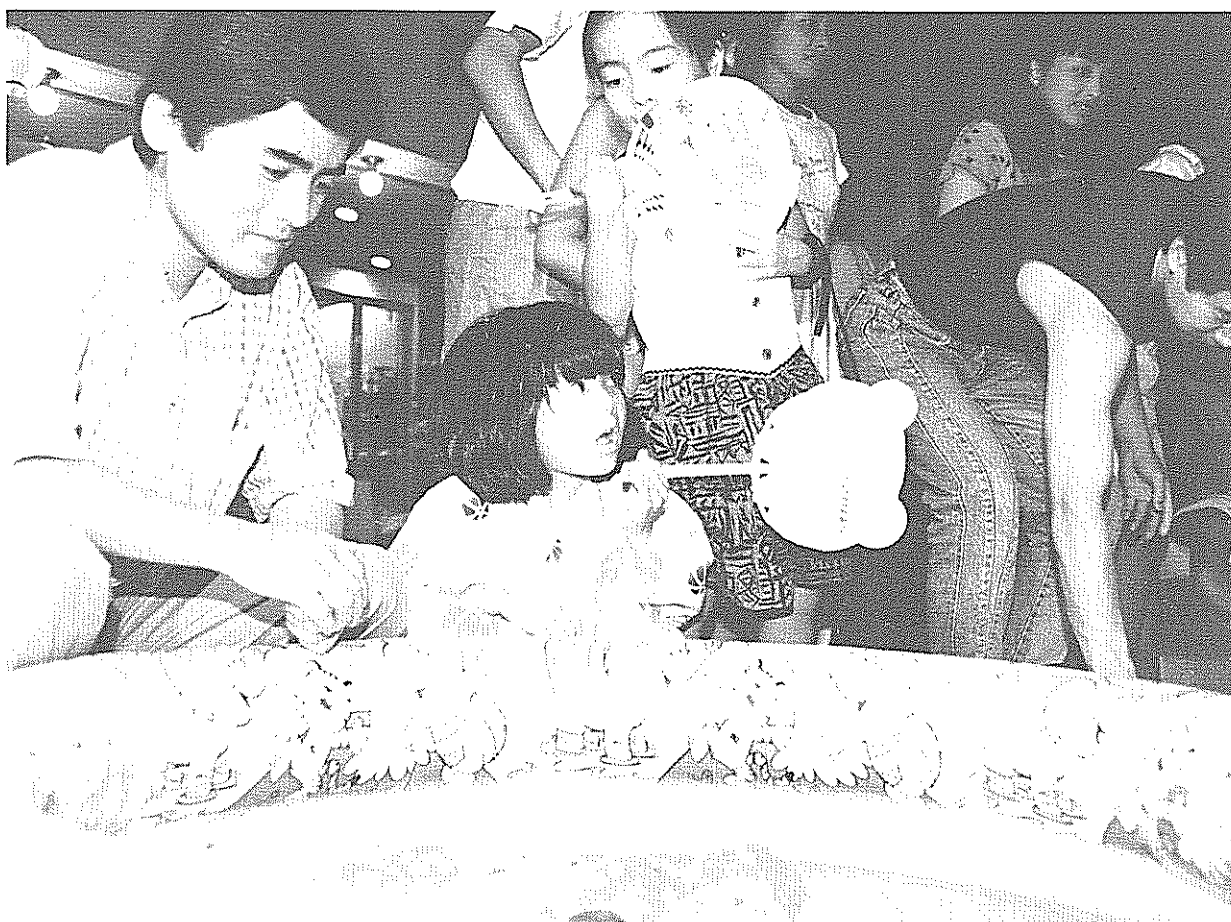
親子でにぎわう土曜夜市