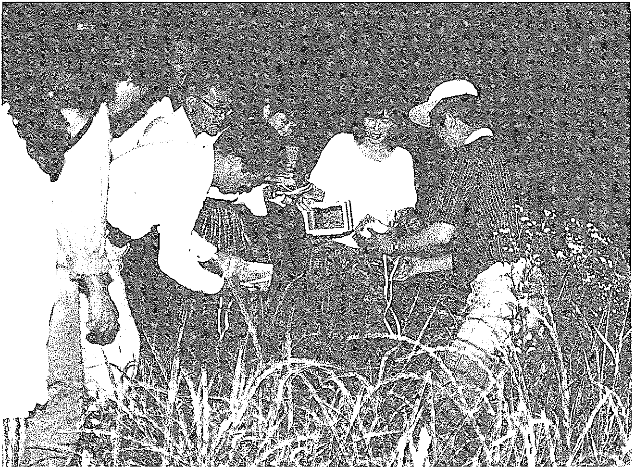
南国市をホタルの里に（6月29日国分川に移植）