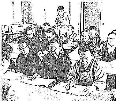
野中地区識字学級